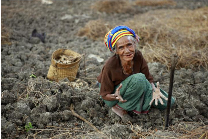
A local woman in Lesuata, Timor-Leste. A team from the UN Integrated Mission in Timor-Leste (UNMIT) visited the area to conduct interviews with the local population and speak with suco (village) chiefs. UNMIT staff conduct these types of visits two to three times a year, often going into villages inaccessible by car

Die Weltbank empfiehlt, dass das Land „seine Wirtschafts- und Einkommensquellen diversifiziert, die Qualität des Bildungs- und Gesundheitswesens erhöht und die Bevölkerung mit nützlichen Qualifikationen ausstattet.“ Dazu müsste eine Strategie verfolgt werden, zeitnah eine große Anzahl an Arbeitsplätzen zu schaffen. Die Berufsausbildung sollte den Absolventen dann einen leichten Einstieg in die produzierenden Gewerbe des Landes ermöglichen.