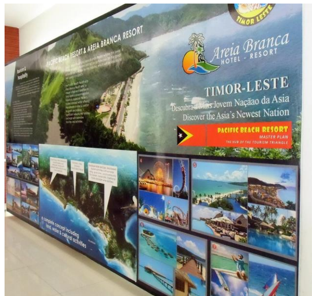
Wer profitiert von dieser Form des Tourismus

Die Projekte selbst sind berechtigterweise umstritten, denn wer von ihnen profitiert ist offensichtlich. Sie ermöglichen es vor allem Politiker*innen und regierungsnahen Unternehmen, sich daran zu bereichern. Nach 10 Jahren können wir deutlich die weit auseinander klaffende Wohlstandsschere in Timor-Leste ausmachen. Und innerhalb einer Dekade hat Timor-Leste eine eigene, sich auf politische und familiäre Beziehungen stützende Elite hervorgebracht, welche sich in zwei politische Lager aufteilen lässt. Im Zentrum dieser stehen Xanana Gusmão und Mari Alkatiri. Sie gelten als die Gründerväter des Landes. Alkatiri initiierte die Unabhängigkeitsbewegung mit seiner FRETILIN Partei und Gusmão führte das Land seit den 1980ern bis zum Referendum. Gusmão wurde auch kürzlich als Verteidiger der Souveränität Timor-Lestes bezeichnet, da er die maritimen Grenzverhandlungen mit Australien entscheiden konnte. Beiden Männern wird jedoch Korruption und Nepotismus unterstellt.