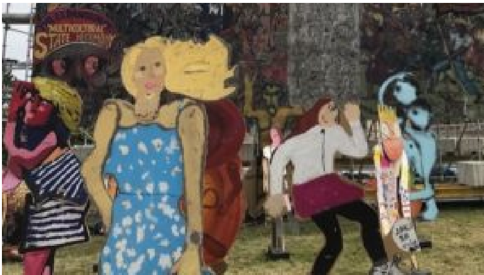
People's Justice mit Wayang Kardus am Friedrichsplatz in Kassel während der documenta fifteen . © Taring Padi

Der experimentelle lumbung -Rahmen verkündet bewundernswert horizontale, egalitäre Werte und bricht die institutionellen Hierarchien auf, die den Weg dafür bereitet haben, dass Kunstveranstaltungen auf der ganzen Welt von Banalität, elitären Interessen und leerem Spektakel gekapert wurden. Das Konzept ermöglicht Künstlern, ihre Arbeit direkt mit dem Publikum in Kontakt zu bringen und sich miteinander zu verbinden. Kunstwerke werden nicht länger durch die Linse einer kuratorischen Thematik und Speicher der Selektivität gefiltert, und Bezugsformen werden nicht von Fachleuten öffentlicher Programme diktiert.