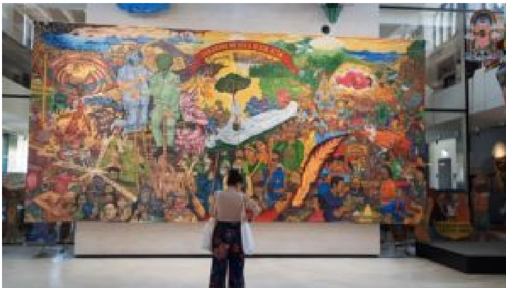
Das Banner Heute die anderen, morgen wir von Taring Padi 2021. © Taring Padi

Als 2019 seine Wahl als Künstlerische Leitung der documenta fifteen bekannt gegeben wurde , verwies das Künstlerkollektiv ruangrupa auf die Ursprünge des Festivals: „Wenn die documenta 1955 antrat, um Wunden des Krieges zu heilen, warum sollten wir nicht versuchen, mit der documenta fifteen das Augenmerk auf heutige Verletzungen zu richten? Insbesondere solche, die ihren Ausgang im Kolonialismus, im Kapitalismus oder in patriarchalen Strukturen haben. Diesen möchten wir partnerschaftliche Modelle gegenüberstellen, die eine andere Sicht auf die Welt ermöglichen.“ Unter Einbeziehung von Kollektiven aus der ganzen Welt und insbesondere der vom Kolonialismus betroffenen Gesellschaften schlug ruangrupa einen kuratorischen Rahmen vor, den sie lumbung nannten – ein Begriff, der im Indonesischen eine kommunale Reisscheune bezeichnet.