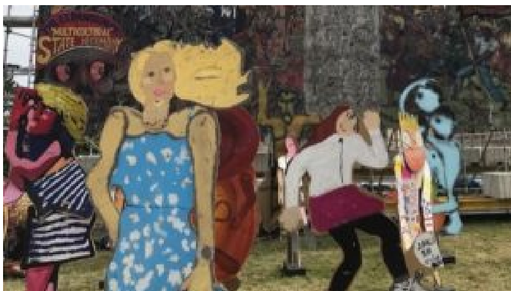
People's Justice mit Wayang Kardus am Friedrichsplatz in Kassel während der documenta fifteen . © Taring Padi

Der experimentelle lumbung -Rahmen verkündet bewundernswert horizontale, egalitäre Werte und bricht die institutionellen Hierarchien auf, die den Weg dafür bereitet haben, dass Kunstveranstaltungen auf der ganzen Welt von Banalität, elitären Interessen und leerem Spektakel gekapert wurden. Das Konzept ermöglicht Künstlern, ihre Arbeit direkt mit dem Publikum in Kontakt zu bringen und sich miteinander zu verbinden. Kunstwerke werden nicht länger durch die Linse einer kuratorischen Thematik und Speicher der Selektivität gefiltert, und Bezugsformen werden nicht von Fachleuten öffentlicher Programme diktiert.