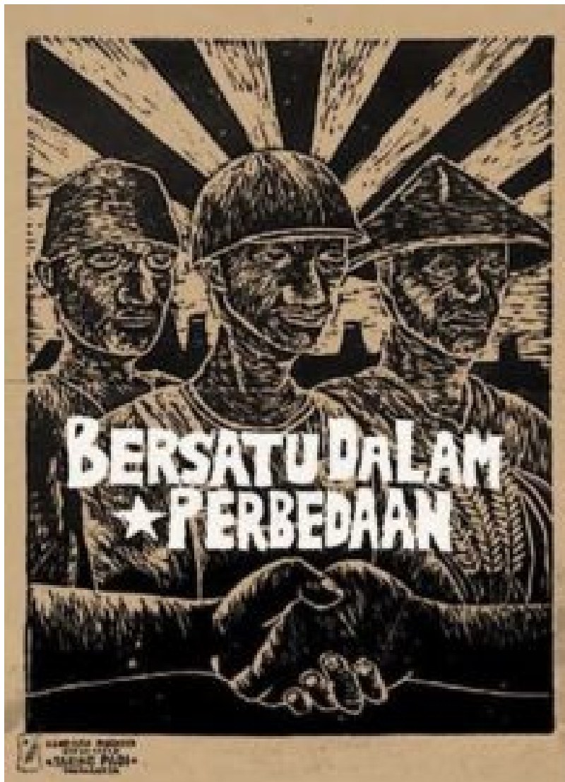
Vereint in Vielfalt aus der Posterserie Für die Menschlichkeit von Taring Padi. © Taring Padi

Dennoch ist die Frage nach dem sozialen Kontext umstritten. Über das demontierte Werk sagt