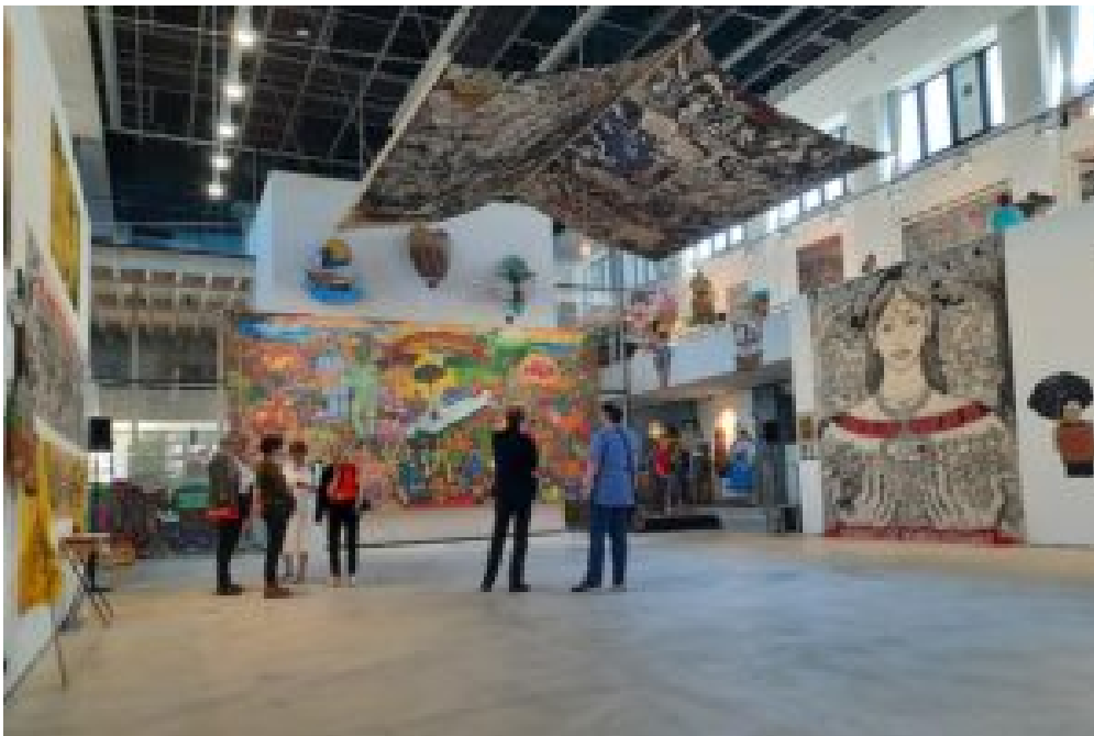
Ausstellung Taring Padi im Hallenbad Ost documenta fifteen . © Taring Padi

„Als konkrete Praxis“, schreibt ruangrupa auf der Website der documenta fifteen , „ist lumbung der Ausgangspunkt der documenta fifteen : Grundsätze von Kollektivität, Ressourcenaufbau und gerechter Verteilung stehen im Mittelpunkt der kuratorischen Arbeit und prägen den gesamten Prozess – die Struktur, das Selbstverständnis und das Erscheinungsbild der documenta fifteen .“