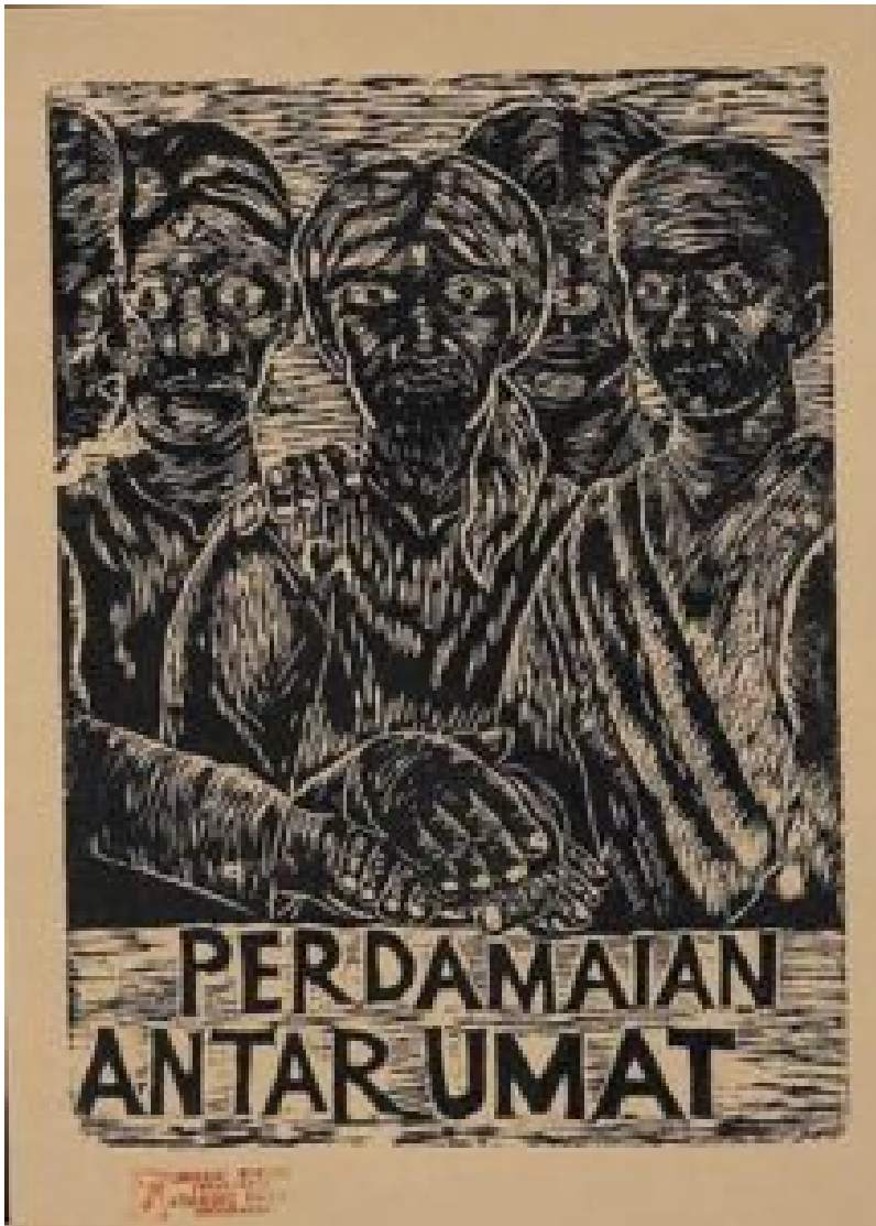
Friede unter den Glaubensgemeinschaften aus der Posterserie Für die Menschlichkeit von Taring Padi. © Taring Padi

Taring Padi's eigener geselliger, kollektiver Zugang zur Kunst ist entscheidend, um zu verstehen, warum es keine einfachen Antworten auf die Frage gibt, wie das anstößige Bild überhaupt auf das Banner gelangen konnte. Taring Padi hat nicht nur viele Mitglieder, die am kreativen Prozess beteiligt sind, sondern lädt auch oft Nichtmitglieder wie zum Beispiel Workshop-Teilnehmer ein, an neuen Werken mitzuarbeiten. Groß angelegte Arbeiten werden zwar in Diskussionen, Notizen und Skizzen geplant und die Arbeitsteilung koordiniert (wenn auch nicht immer strikt durchgesetzt). Es ist jedoch ein Prozess, der bewusst auf Autorenschaft verzichtet - Werke werden nicht von Einzelpersonen signiert, sondern mit dem unverwechselbaren Logo des Kollektivs versehen. Wie Bambang Agung in Taring Padi: Seni Membongkar Tirani ( Kunst zerstört Tyrannei ) schrieb: „Kollektive Kunstwerke sind mit anderen Worten eine Kritik an der Vergegenständlichung von Kunst und der fortschreitenden Kommerzialisierung ihrer Künstler.“