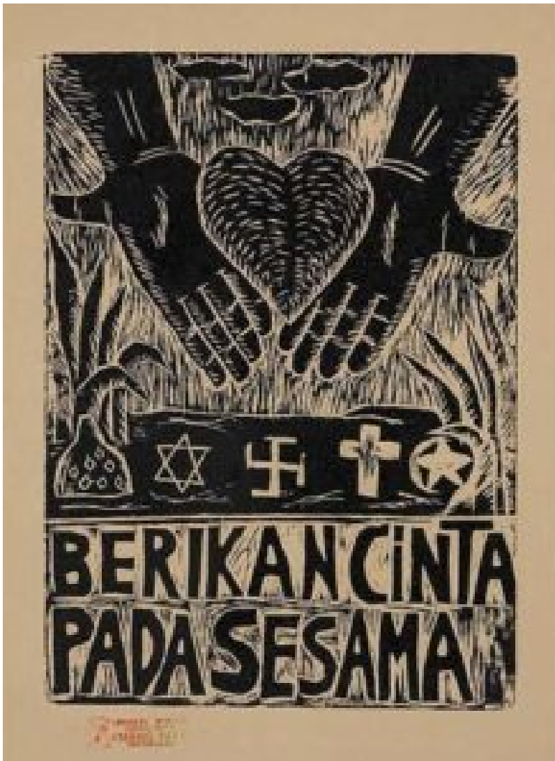
Liebe Deinen Nächsten aus der Posterserie Für die Menschlichkeit von Taring Padi. © Taring Padi

Es müssen auch wichtige Fragen dazu gestellt werden, wie visuelle Darstellungen in diesem Rahmen berücksichtigt werden sollten. Der Fokus auf Prozess, Konzept und Dialog ist von größter