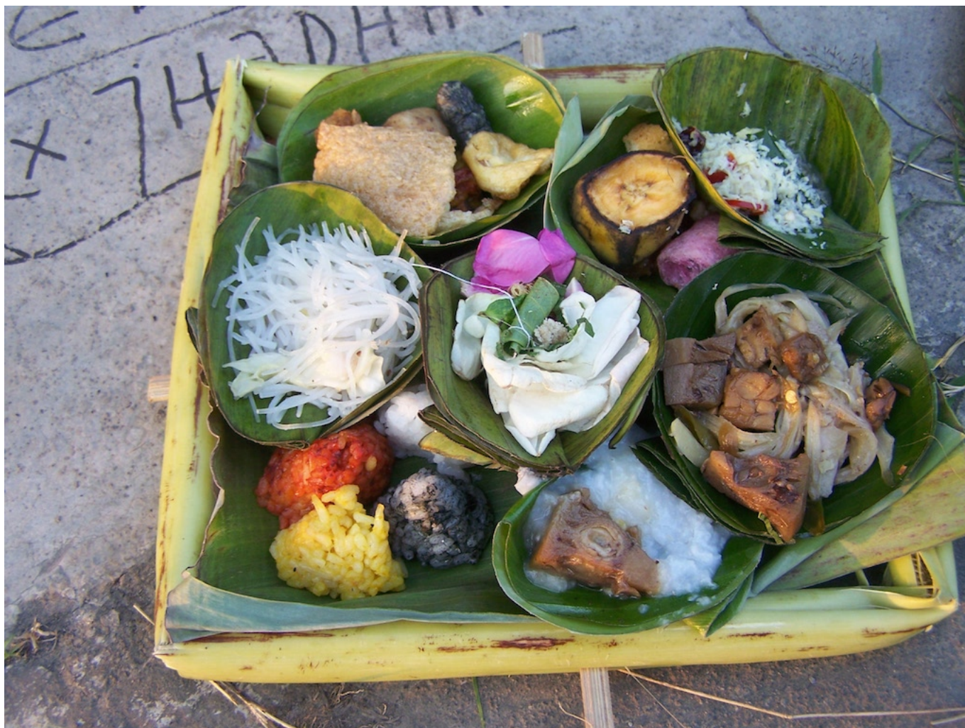
Opfergaben in einem Dorf im Süden Yogyakartas

Das Bespenden scheint dem Befrieden der dschinn durch kleine Opfergaben ähnlich zu sein. Hier wird jedoch die Intention anders gefasst, um sich dem orthodox-islamischen Rahmen anzupassen. Damit ist gemeint, dass ein Befrieden der dschinn durch Opfergaben abgelehnt und als göttliche Beigesellung (Ind.: syirik ; Arab.: shirk ) verstanden wird. Bekämpft werden die dschinn vor allem durch Austreibungen, ( ruk yah auf Indonesisch), mit Hilfe von Wasser und dem Lesen des Qur'an. Diese Form der Austreibung ist besonders populär geworden unter den Muslim*innen, die man den verschiedenen Strömungen des Salafi -Wahhabismus zuordnet.