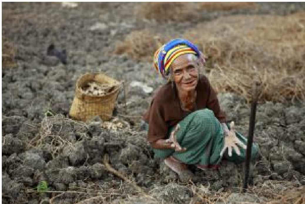
Landarbeiterin in Timor-Leste

Zur Verwaltung der Öl- und Gaseinnahmen richtete Timor-Leste kurz nach Erlangung seiner Unabhängigkeit von Indonesien 2002 einen Fond ein. Wie man mit den Erträgen umgehen soll, war von Anfang an umstritten: Sollten die Einkünfte für die Zukunft angelegt oder in aktuelle entwicklungsbedürftige Bereiche wie Bildung und Gesundheit, Ausbildung von Fachkräften etc. investiert werden? Obwohl also gesetzlich vorgeschrieben war, die Gewinne in den Fond einzuzahlen, konnte bis heute die Armut im Land mit diesen Einnahmen kaum gemildert werden.