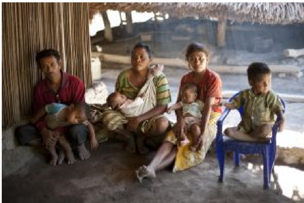
Dörfliches Leben an der Grenze zu Indonesien

Keine der großen Parteien, die bei der vorgezogenen Wahl am 12. Mai 2018 antraten, wird die Armutsbekämpfung im Land drastisch verbessern. Die FRETILIN hätte unter Alkatiris strikt reglementierter Führung die Elite noch exklusiver gefördert. Auch Xanana Gusmão und die CNRT werden die Ausbreitung der Korruption im Land nicht unterbinden. Ein wenig Hoffnung auf Veränderung bietet die neue Partei PLP um Expräsidenten Taur Matan Ruak mit seinem überwiegend jungen Team.