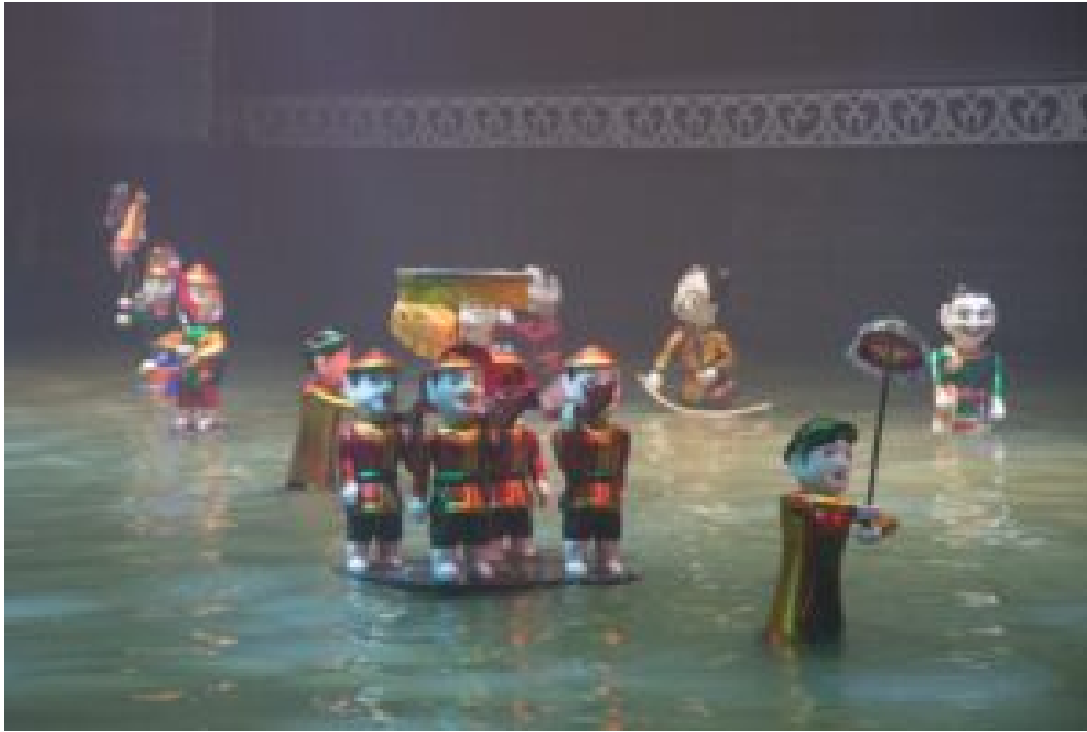
Puppen in einer Sänfte gleiten über das Wasser.

Andere Stücke erzählen unsere alten Mythen und Legenden, die über Generationen weitergegeben wurden und weit bekannt sind. Ein Beispiel ist die Legende Sơn Tinh - Thủy Tinh (Gott der Berge und des Wassers). Sie handelt von den saisonalen Monsunen die Vietnam heimsuchen und dem harten Kampf unserer Vorfahren gegen deren verheerende Folgen.