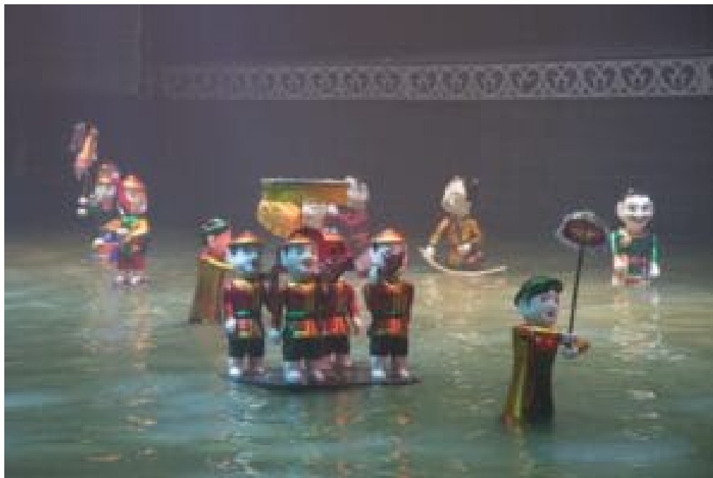
Puppen in einer Sänfte gleiten über das Wasser.

Andere Stücke erzählen unsere alten Mythen und Legenden, die über Generationen weitergegeben wurden und weit bekannt sind. Ein Beispiel ist die Legende Sơn Tinh - Thủy Tinh (Gott der Berge und des Wassers). Sie handelt von den saisonalen Monsunen die Vietnam heimsuchen und dem harten Kampf unserer Vorfahren gegen deren verheerende Folgen.