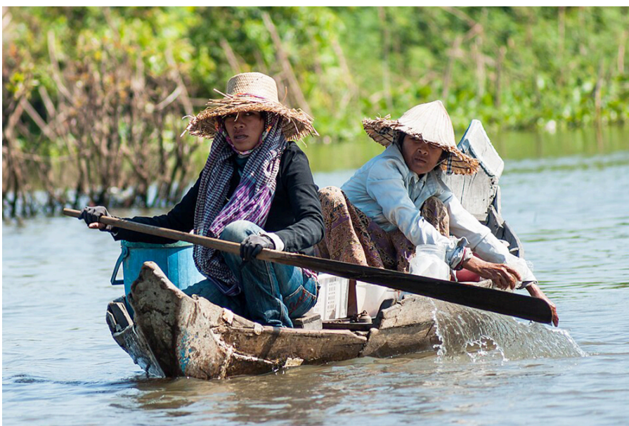
Frauen bei der Verrichtung körperlicher Arbeit in einem schwimmenden Dorf auf dem Tonle Sap Sees.

Die Frauenrechte in Kambodscha haben bedeutende Fortschritte gemacht. Mindestens 16 internationale Organisationen sowie lokale NGOs setzen sich aktiv für mehr Geschlechtergleichheit ein. Dennoch zeigt sich weiterhin ein starkes Gegenwirken durch strukturelle Diskriminierung und eine stereotype Vorstellung von Männlichkeit, sowohl innerhalb der Familie als auch in sozialen und wirtschaftlichen Strukturen.