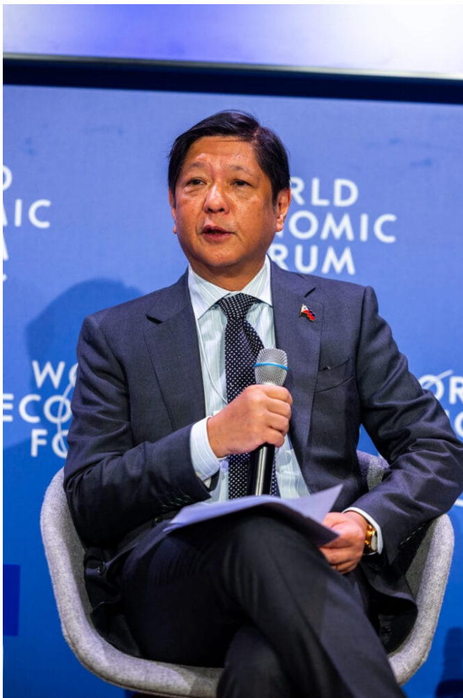
Präsident Ferdinand Marcos Jr. auf dem Weltwirtschaftstreffen 2023 in Davos, Schweiz.