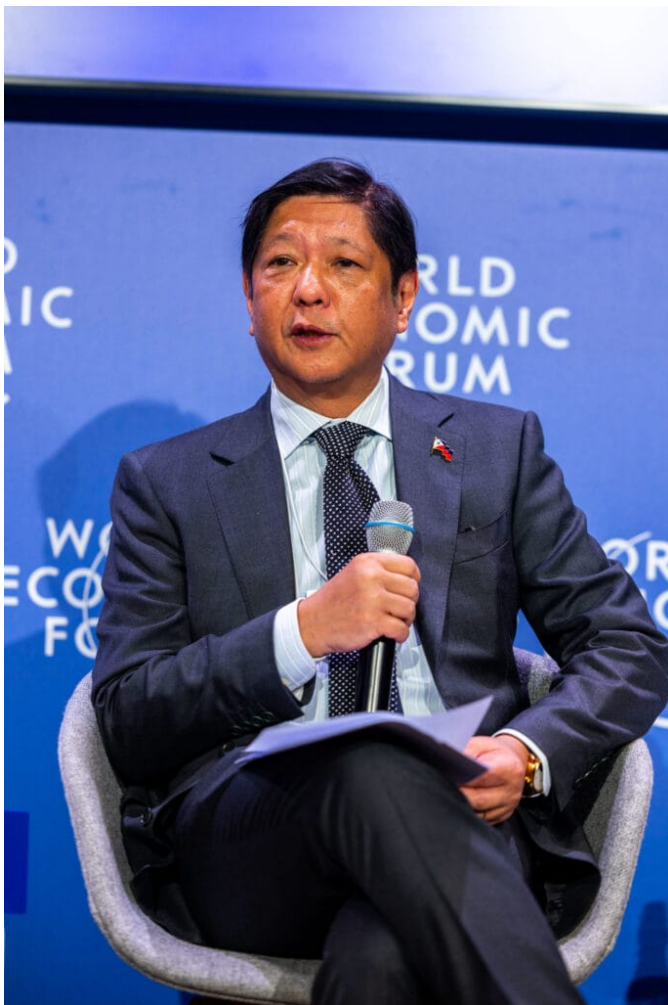
Präsident Ferdinand Marcos Jr. auf dem Weltwirtschaftstreffen 2023 in Davos, Schweiz.