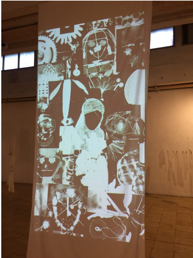
Fotocollage auf der Ausstellung „(Im)possible Identities – or how can we learn from ghosts?“