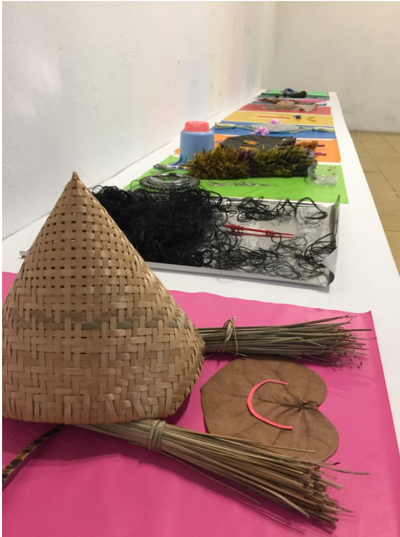
Assemblagen aus Objekten, die in Verbindung mit Geistern stehen © Dimaz Maulana