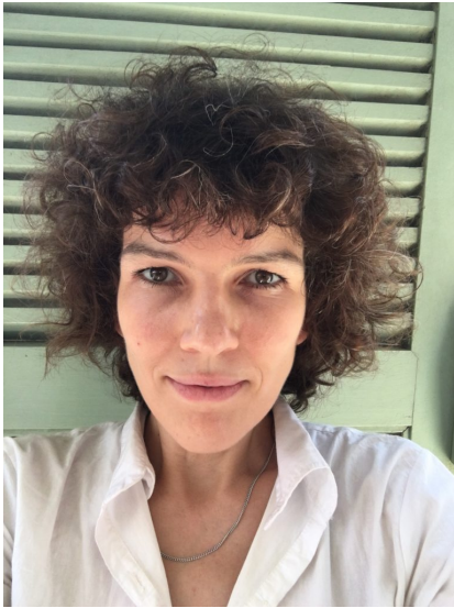
Katharina Duve © privat