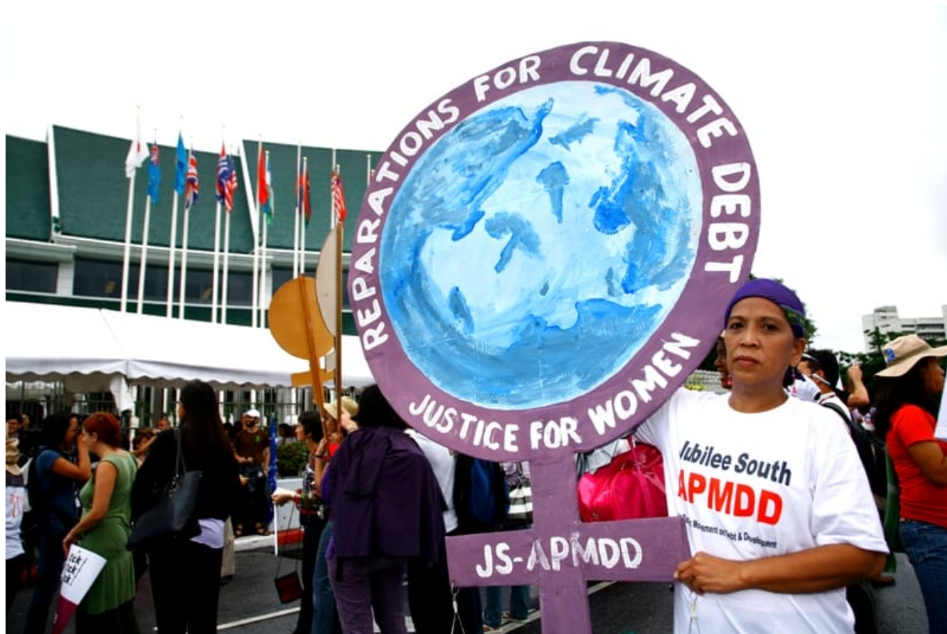
Zivilgesellschaftlicher Protest 2009 vor dem Gebäude der Vereinten Nationen in Bangkok

Wie in Deutschland auch, geht groß dimensionierte Infrastruktur häufig mit einem Abbau von Arbeitsplätzen am unteren Ende der Verdienstsкала einher: Die neue Brücke ersetzt die Fährleute, die Eisenbahn ersetzt die bislang kleinunternehmerisch organisierten Lkw-Fahrenden. Das heißt natürlich nicht, dass solche Investitionen grundsätzlich entwicklungsfeindlich wären – im Gegenteil. Die soziale Infrastruktur, die solche Arbeitsplatzverluste vorübergehend auffangen könnte, und die gezielte Schaffung neuer und moderner Arbeitsplätze auf der Grundlage der neu geschaffenen Infrastruktur sind aber im Regelfall nicht Teil der Projektfinanzierung. Vielmehr werden die Betroffenen sich selbst überlassen.