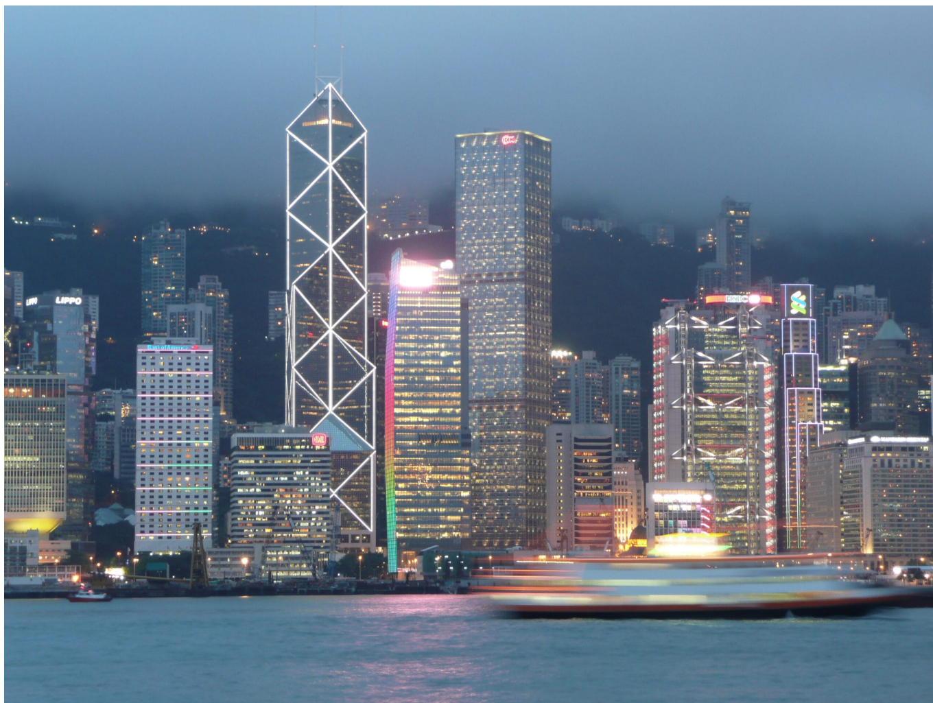
Finanzdrehscheibe: Hongkongs Banken Distrikt mit der Bank of China, Hongkong and Shanghai Banking Corporation und Standard Chartered Bank