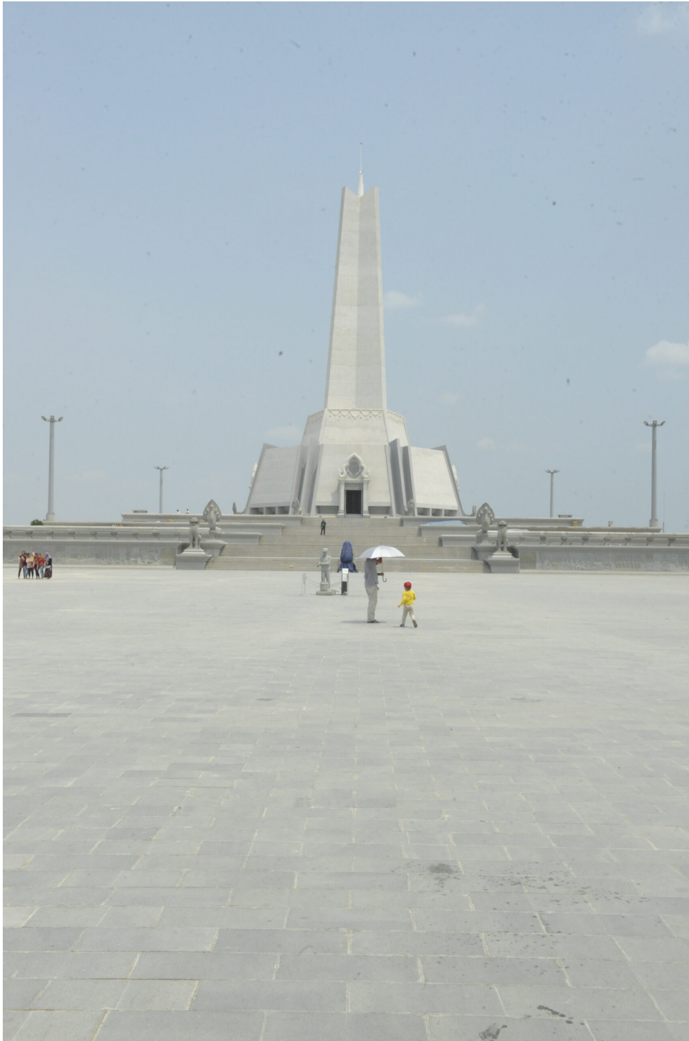
Das neue Hun-Sen Monument in Phnom Penh

In einem im März 2015 veröffentlichten Bericht verwies Human Rights Watch auf mutmaßliche Missbräuche in kambodschanischen Zulieferbetrieben für Bekleidungsartikel, die große Marken wie Marks & Spencer , Adidas und Armani beliefern. Die Rechte der Arbeitnehmer*innen werden aufgrund des „Umschlagsystems“ weiterhin verletzt. (vergleiche dazu auch den Artikel „(K)ein unerklärliches Phänomen: Massenohnmachten in kambodschanischen Bekleidungs- und Schuhfabriken“ von Tharo Khun) Die Fabrikmanager*innen geben Bestechungsgelder an die Inspektor*innen weiter, um begünstigende Berichte zu erhalten.