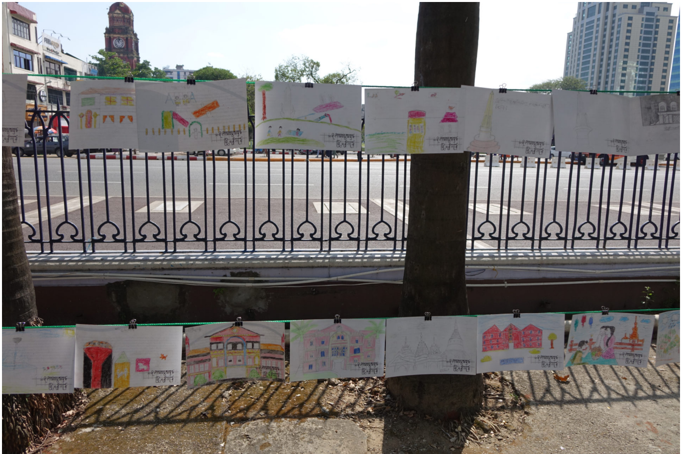
Installation der Postkarten vor dem Rathaus, mit High Court im Hintergrund (links)