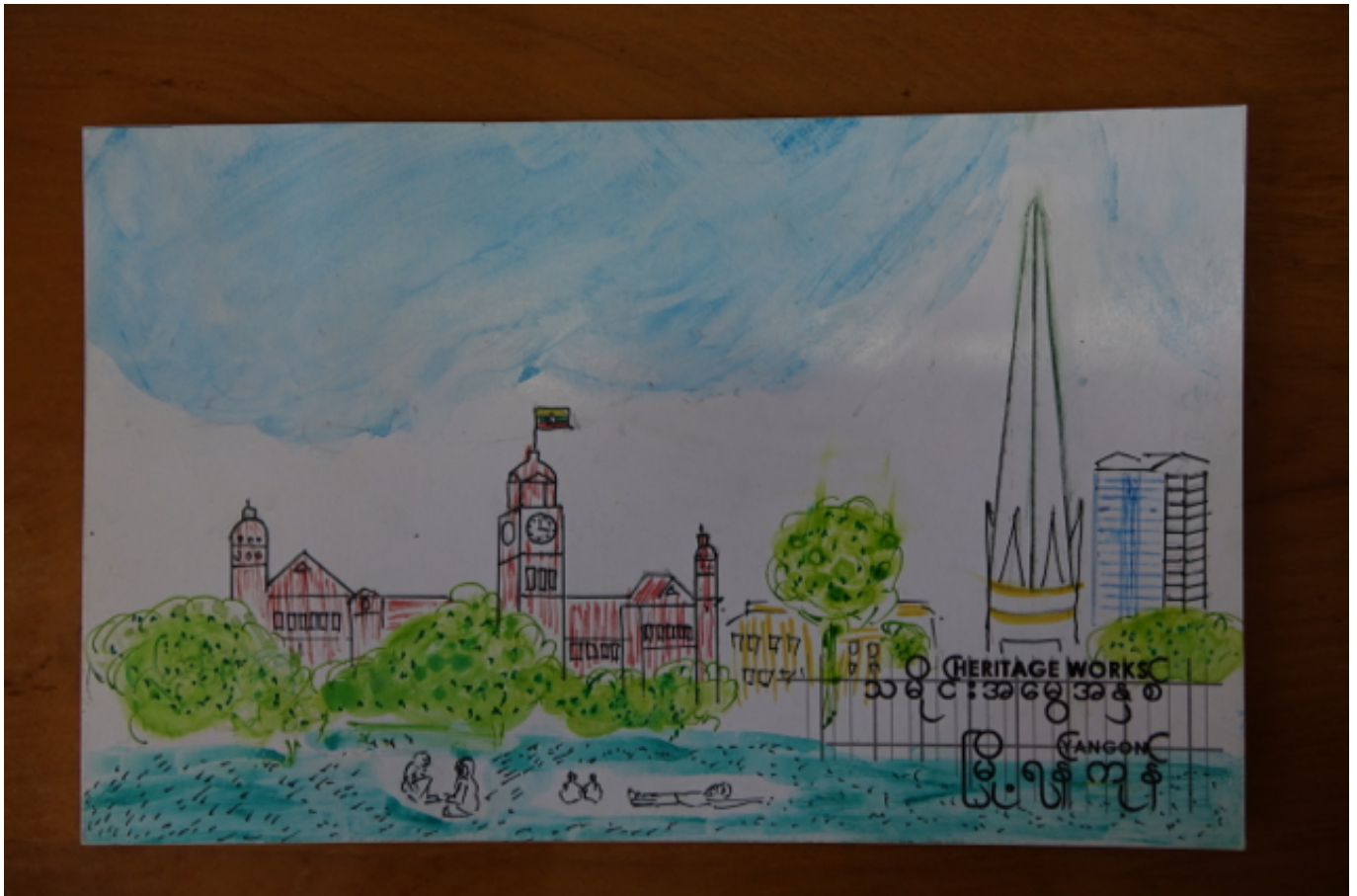
Gemaltes Bild des Hohen Gerichtshofs ( High Court ), mit Unabhängigkeitssäule

Diese Sätze sind kein Zeugnis eines ‚authentischen‘ Empfindens. Wenn man die Postkartenaktion als Erinnerungsprojekt versteht, ist vor allem deren Entstehungsprozess bedeutsam: Was bedeutet es für das größere Anliegen, die Wertschätzung der Kolonialbauten zu erhöhen, wenn vor Yangons Rathaus Hunderte von bunten Postkarten im Wind baumeln, die vorgeblich demonstrieren, wie sehr bereits Kinder das Stadtbild und einzelne Gebäude schätzen? Meines Erachtens stellt die Postkartenaktion einen spannenden Versuch da, etwas zu demonstrieren, was man eigentlich erst erzeugen will – dass Kinder ihre Stadt und deren historische Gebäude schätzen. Es kann kaum eine bessere Rechtfertigung für eine umfassende stadtplanerische Neuausrichtung im Namen von heritage geben. Aber die Postkarten zeigten mitnichten die Lieblingsorte der Kinder – vielmehr demonstrierten sie den Mangel an Vertrautheit der Schüler*innen damit, auf diese Weise über eine Stadt (oder Streetscape ) nachzudenken, oder öffentliche Gebäude als etwas zu verstehen, das man mögen kann.