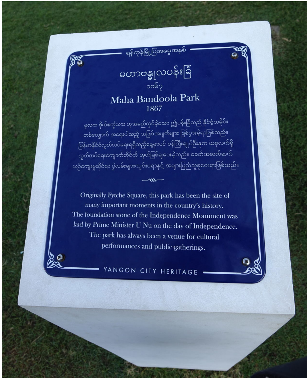
Blaue Plakette im Mahabandoola-Park

Doch die monumentalen Gebäude waren für die Stadtbevölkerung – abgesehen von der Bildungselite, die als Verwaltungskräfte und Politiker*innen dort ein- und ausgingen – keine wertvollen Erinnerungsorte. Die Bemühungen, mit der Unabhängigkeit 1948 eine neue nationale Identität zu gestalten, waren primär antikolonial und bezogen sich auf die Zeit der buddhistischen Königtümer. Über Jahrzehnte pflegte niemand die Wertschätzung kolonialer Architektur. Im Gegenteil: die urbane Bevölkerung wurde noch mehr von den Prachtbauten entfremdet, da diese (wenn auch widerwillig) von der ungeliebten Militärregierung genutzt wurden.