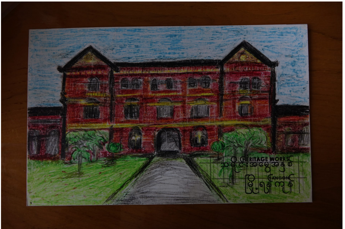
Bild des ‚Secretariat‘ in Yangon, erstellt im Rahmen von Heritage Works! (2015)

Myanmar: Yangons koloniale Architektur ist weltberühmt. Seit 2013 versuchen Organisationen, die lokale Bevölkerung für dieses zwiespältige Erbe zu sensibilisieren. Dafür braucht es jedoch mehr als einen elitären Diskurs.