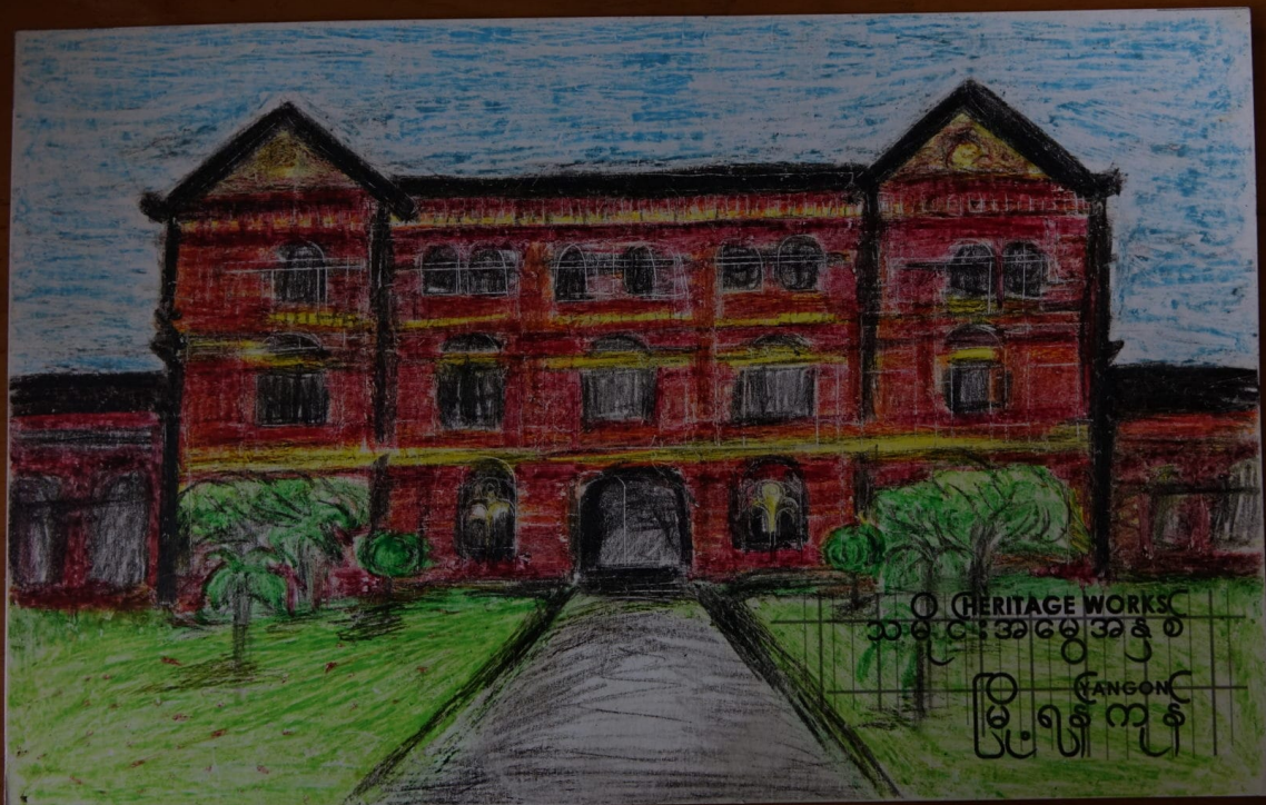
Bild des ‚Secretariat‘ in Yangon, erstellt im Rahmen von Heritage Works! (2015)

Myanmar: Yangons koloniale Architektur ist weltberühmt. Seit 2013 versuchen Organisationen, die lokale Bevölkerung für dieses zwiespältige Erbe zu sensibilisieren. Dafür braucht es jedoch mehr als einen elitären Diskurs.