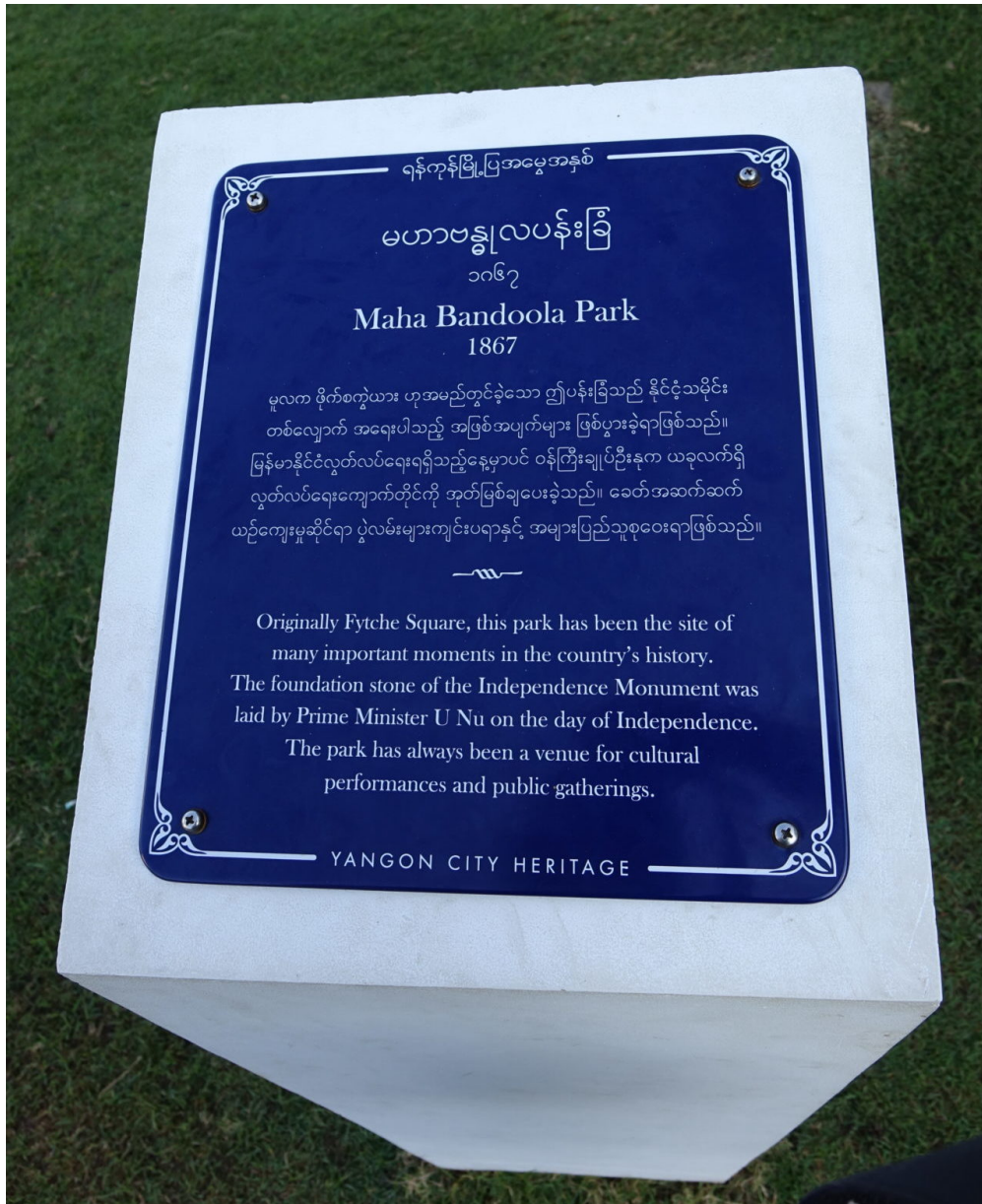
Blaue Plakette im Mahabandoola-Park

wertvollen Erinnerungsorte. Die Bemühungen, mit der Unabhängigkeit 1948 eine neue nationale Identität zu gestalten, waren primär antikolonial und bezogen sich auf die Zeit der buddhistischen Königtümer. Über Jahrzehnte pflegte niemand die Wertschätzung kolonialer Architektur. Im Gegenteil: die urbane Bevölkerung wurde noch mehr von den Prachtbauten entfremdet, da diese (wenn auch widerwillig) von der ungeliebten Militärregierung genutzt wurden.