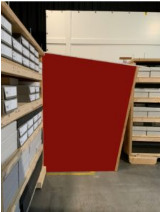
NegativeSpace Wut Rot 2021 Fotomontage.