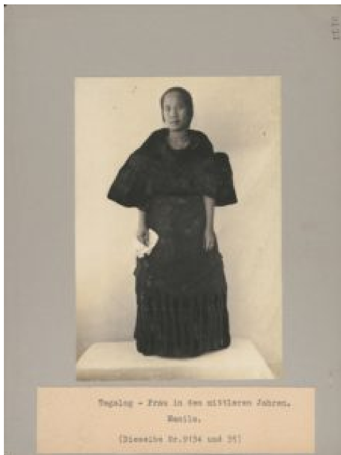
Tagalog Woman.

„Gibt es eine Erlösung in diesen Fotos? Würde ich lügen, wenn ich zustimme, dass diese Fotografien — die als Instrumente zur Unterdrückung und Herabsetzung benutzt wurden — in Werkzeuge zur