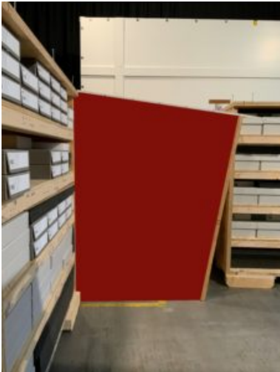
NegativeSpace Wut Rot 2021 Fotomontage.