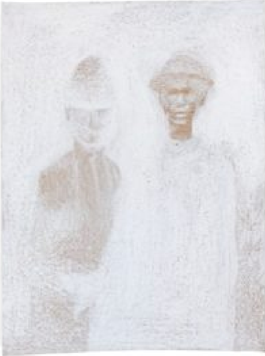
Dekoloniale Trübung. © Jaclyn Reyes

„Als Filipina, die in den Vereinigten Staaten geboren und aufgewachsen ist, hielt ich es für wichtig, mich mit einem US-amerikanischen Archiv zu beschäftigen, insbesondere mit Bildern, die sich in der Library of Congress befinden. Ich beschloss, Zeichnungen anzufertigen, um eine Intimität mit den fotografischen Bildern aufzubauen und zu versuchen, Zugang zum Inneren der Figuren zu erhalten. Gleichzeitig war diese Erkundung eine Übung in dekolonialer Praxis, um dem Einfluss des kolonialen Archivs zu widerstehen.