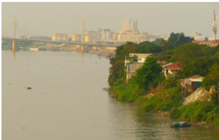
Der Tonle Sap bei Phnom Penh.

Auch die Staudämme der Wasserkraftwerke am Lauf des Mekong - vor allem in China, wo der Fluss Lancang genannt wird - und seiner Nebenarme beeinflussen das Ökosystem Tonle Sap stark. Sie verhindern nicht nur die Fischwanderung, sondern ändern auch die Wassermengen, da sie am Oberlauf in China große Mengen Wasser zurückhalten und so den natürlichen Wasserkreislauf unterbrechen.