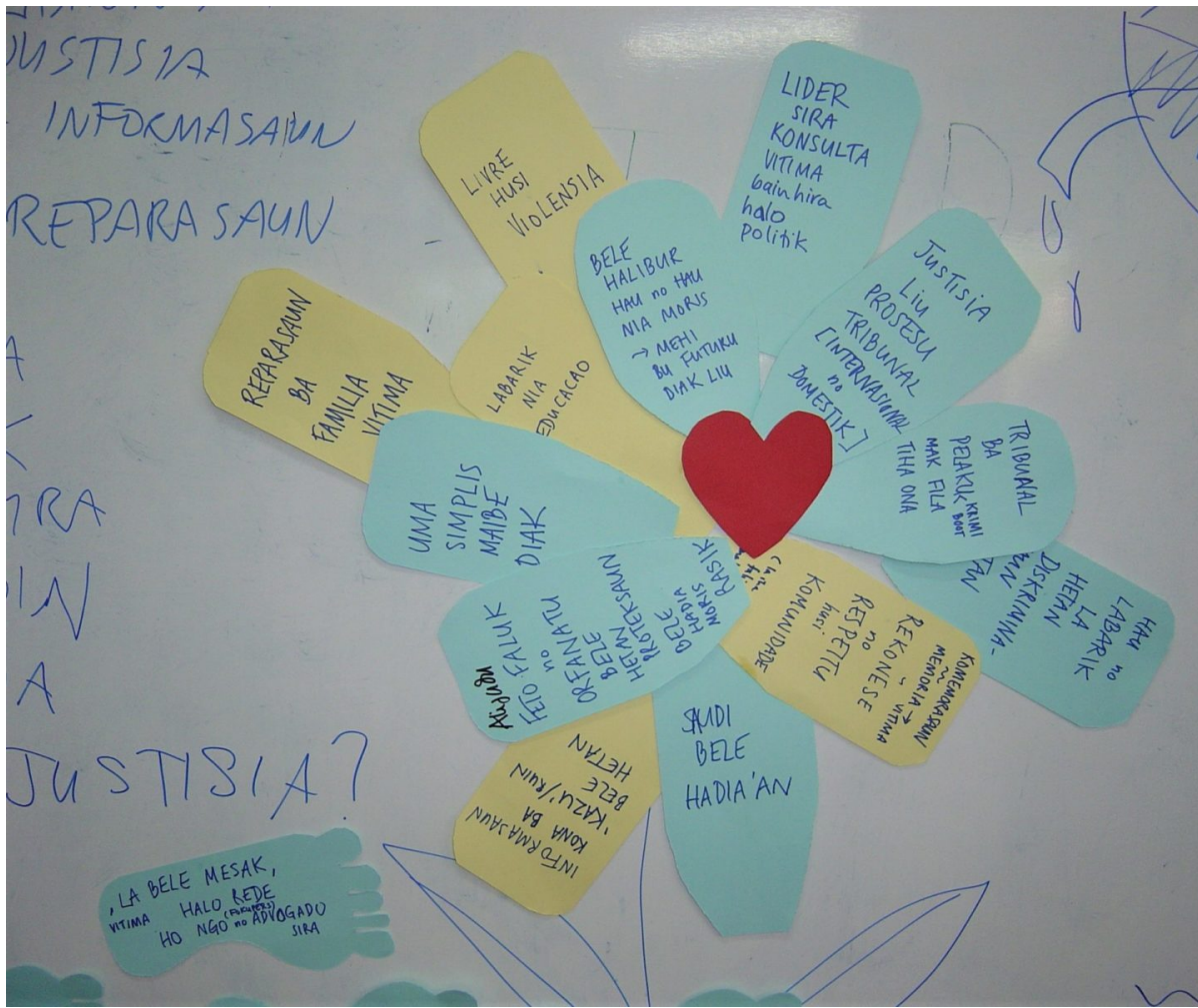
Workshop mit Opfern zur Frage ‚Wie denken Frauen über Gerechtigkeit?‘ bei Fokupers

Frauen wurden von ihrer eigenen Gesellschaft und vielerorts auch von der örtlichen Kirche ausgegrenzt, die dabei versagten, den Frauen beizustehen. Schlimmer noch, die Gewalttaten wurden tabuisiert. Der Bericht der Wahrheitskommission gab im Kapitel zu „sexueller Gewalt“ auf über 100 Seiten Zeugnis des erlebten Grauens. Die Kommission formulierte Empfehlungen an Regierung, zivilgesellschaftliche und religiöse Organisationen, wie man den Bedürfnissen der Opfer gerecht und Gewalt gegen Frauen in der Gesellschaft gestoppt werden könnte.