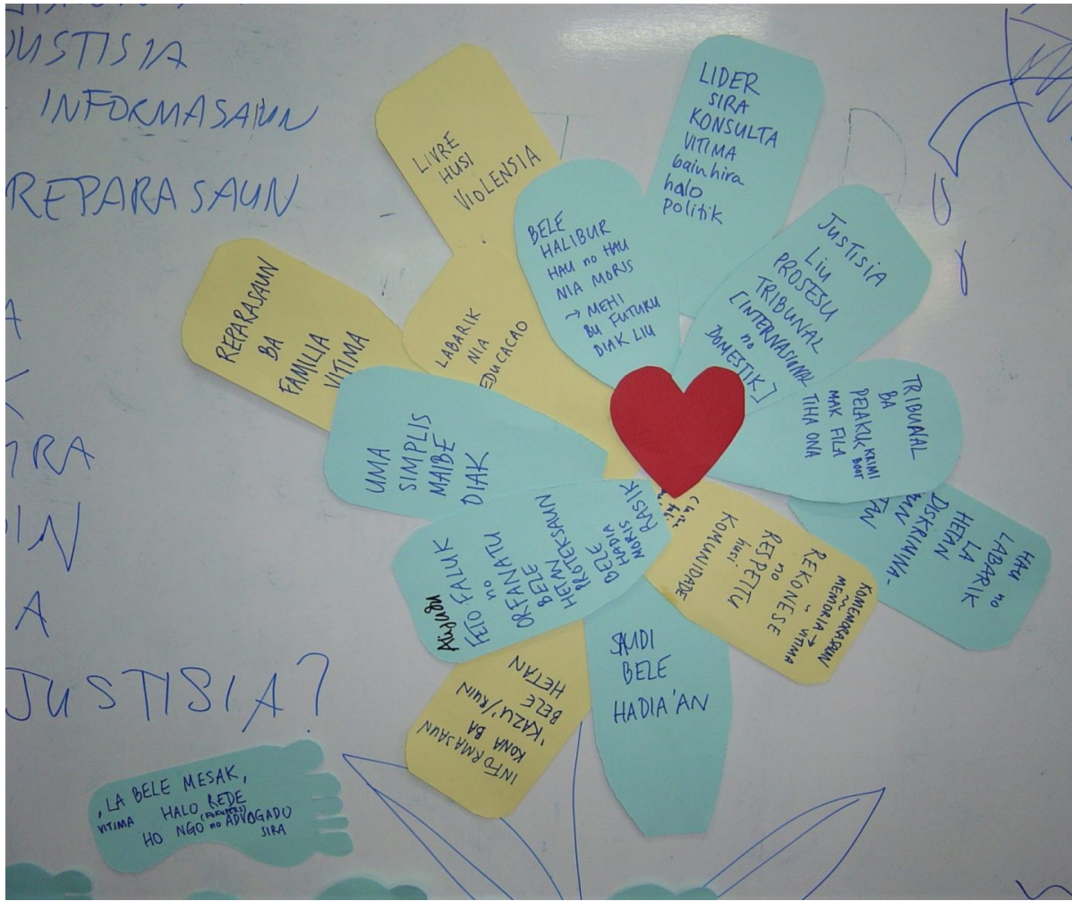
Workshop mit Opfern zur Frage ‚Wie denken Frauen über Gerechtigkeit?‘ bei Fokupers

Frauen wurden von ihrer eigenen Gesellschaft und vielerorts auch von der örtlichen Kirche ausgegrenzt, die dabei versagten, den Frauen beizustehen. Schlimmer noch, die Gewalttaten wurden tabuisiert. Der Bericht der Wahrheitskommission gab im Kapitel zu „sexueller Gewalt“ auf über 100 Seiten Zeugnis des erlebten Grauens. Die Kommission formulierte Empfehlungen an Regierung, zivilgesellschaftliche und religiöse Organisationen, wie man den Bedürfnissen der Opfer gerecht und Gewalt gegen Frauen in der Gesellschaft gestoppt werden könnte.