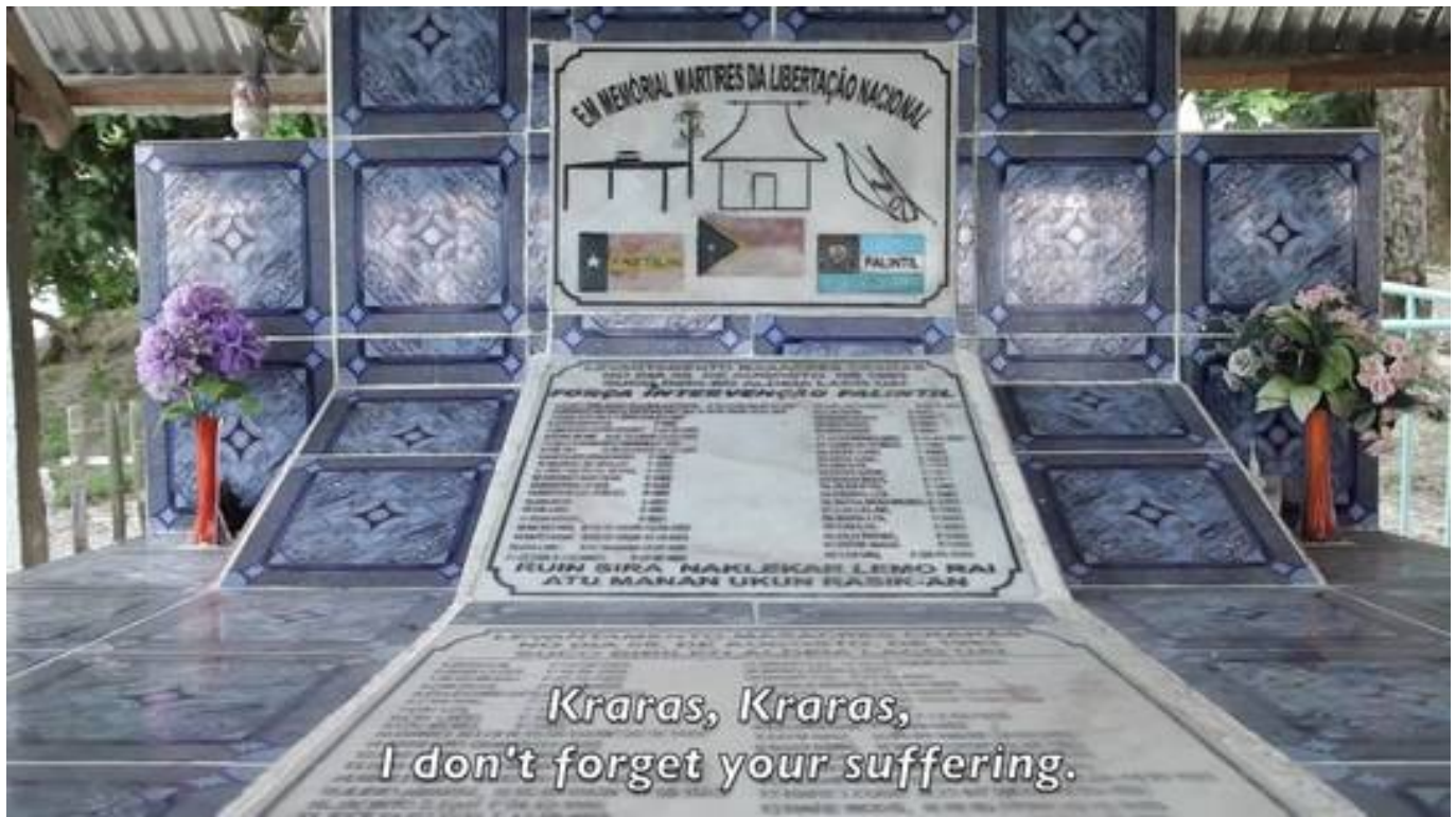
Gedenkstätte für die Opfer des Massakers von Kraras