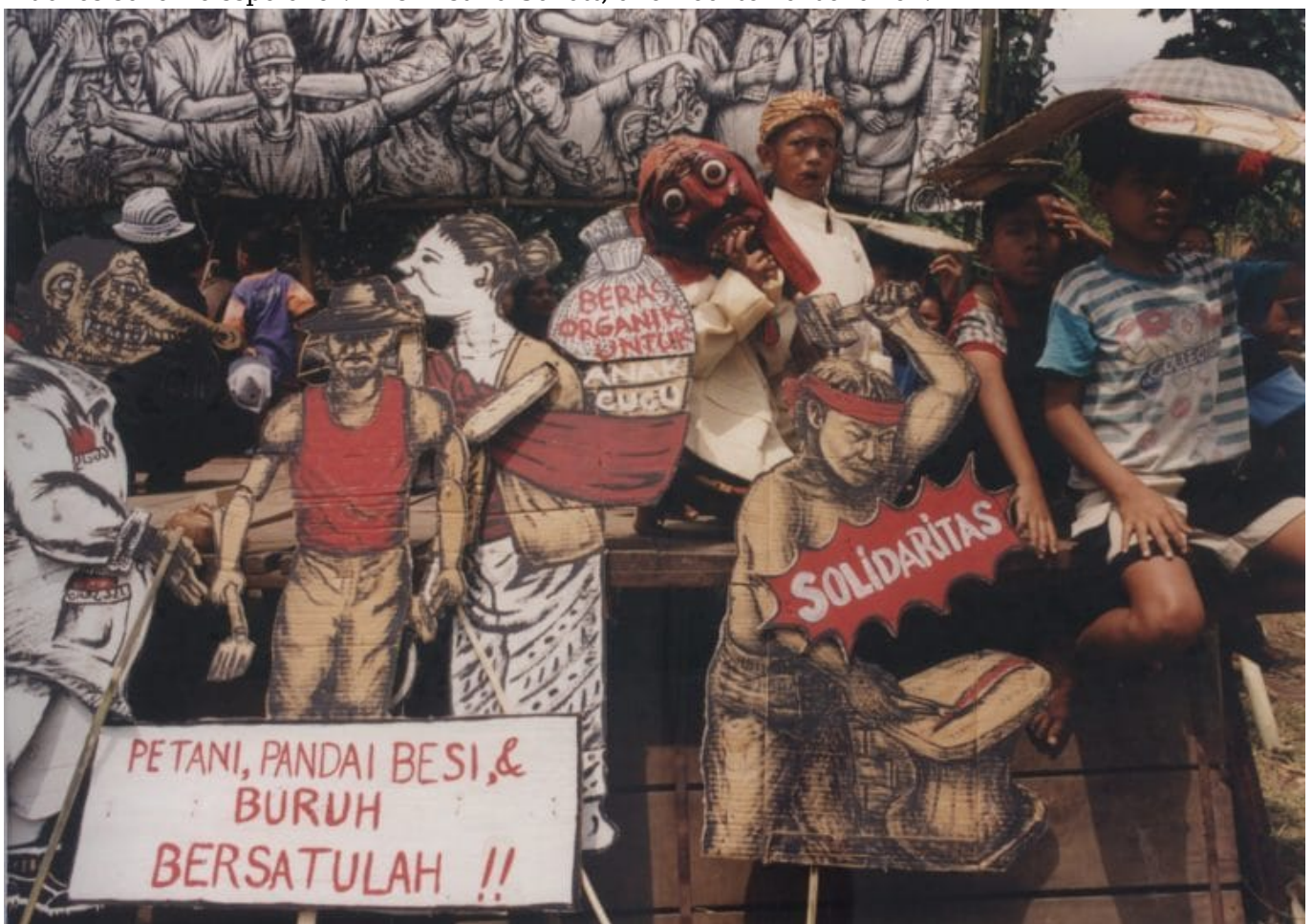
Die Wurzeln des gemeinschaftlichen Arbeitens in der indonesischen Kunst und wie sie sich im letzten Jahrhundert weiterentwickelt hat, analysiert die Kunsthistorikerin Claudia König.