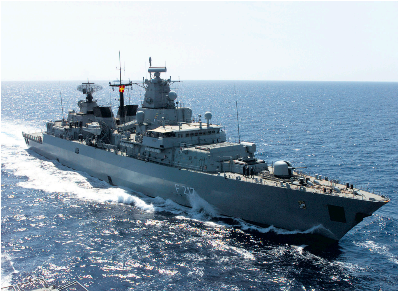
Die Fregatte Bayern während der Operation Enduring Freedom

Anforderungen der jüngst herausgegebenen Leitlinien für den Indo-Pazifik: „Wir werden Flagge zeigen für unsere Werte, Interessen und Partner“. Anfang März 2021 veröffentlichten dann das Auswärtige Amt und das Bundesministerium für Verteidigung konkrete Details zu der anstehenden Fahrt der Fregatte. Ab August soll diese ihre etwa sechsmonatige Reise antreten, dabei mehr als ein Dutzend Hafenbesuche zwischen dem Horn von Afrika, Australien und Japan im Indo-Pazifik absolvieren. Operativer Höhepunkt der Tour soll die etwa dreiwöchige Teilnahme an den VN-Sanktionsmaßnahmen gegenüber Nordkorea darstellen.