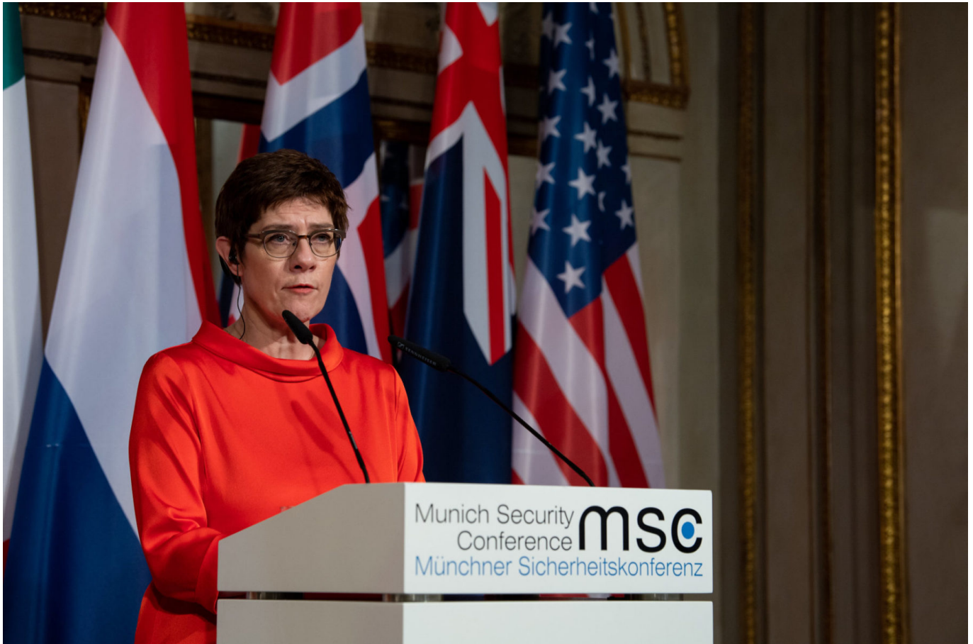
Verteidigungsministerin Annegret Kramp-Karrenbauer bei der Münchner Sicherheitskonferenz 2020

und global agierende Terror-Organisationen, Piraterie, organisierte Kriminalität, die Auswirkungen von Naturkatastrophen sowie Migrationsbewegungen. Gerade die zuletzt genannten Aspekte, die eher zu den nicht-traditionellen Sicherheitsbedrohungen zählen, stehen bei den Anrainern des Indo-Pazifiks weit oben auf der sicherheitspolitischen Agenda. Das breite Spektrum an sicherheitspolitischen Bedrohungen steht in einem offensichtlichen Spannungsverhältnis zu der Bedeutung des Indo-Pazifiks für globale Warenströme.