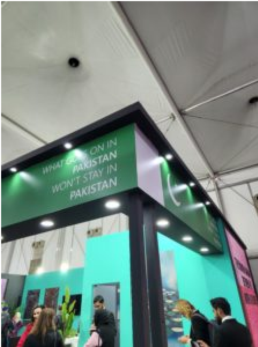
Pakistan erinnert im eigenen Pavillon auf der COP27 daran, dass Klimawandel alle angeht.

Selbst wenn sie nicht als Block verhandeln, kann unter dem ASEAN-Schirm während der COPs eine Menge getan werden. ASEAN gibt im Vorfeld der COP eine Erklärung ab. Die ASEAN-Verhandlungsführer sollten während der COP mindestens zweimal als Kollektiv zusammenkommen, um Fragen zu erörtern, die sich aus den Verhandlungen ergeben und um unterschiedliche Positionen der ASEAN-Länder innerhalb der verschiedenen Blöcke, an denen sie beteiligt sind, in Einklang zu bringen.