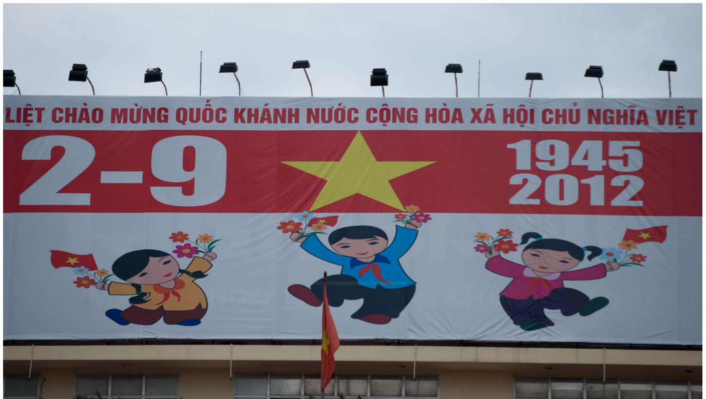
Banner zu 67 Jahren Unabhängigkeit Vietnams 2012

freie Wahlen 1956 besiegeln. Bis dahin wurde entlang des 17. Breitengrads eine militärische Demarkationslinie gezogen, die das Land faktisch teilte. Zu Beginn der 1960er Jahre war die Chance einer friedlichen Wiedervereinigung vertan und der innervietnamesische Konflikt durch die West-Ost-Blockkonfrontation internationalisiert worden.