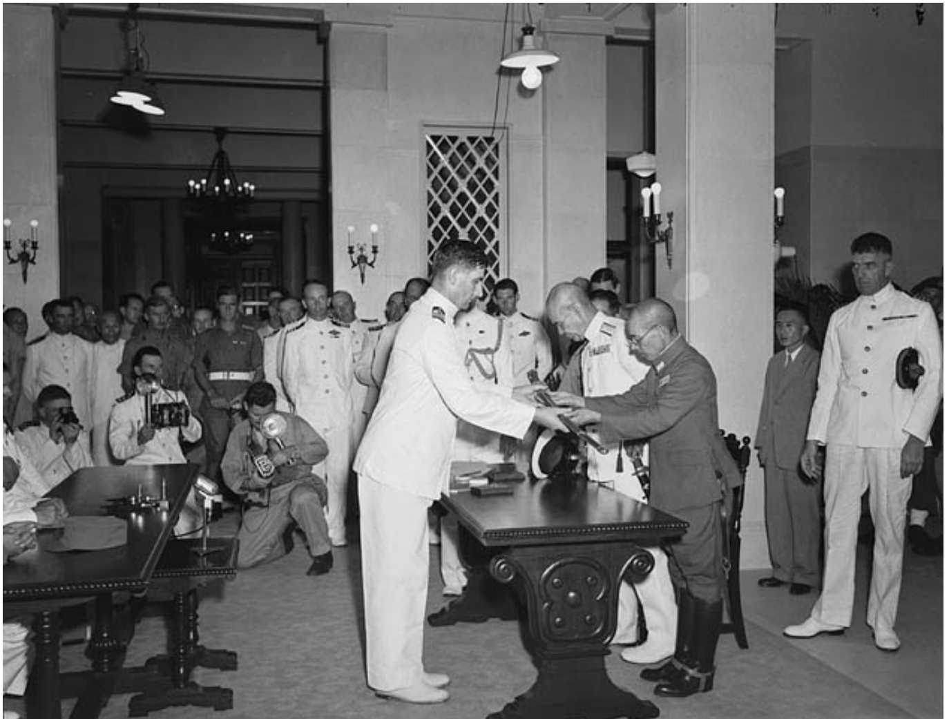
Maj.-Gen. Okada übergibt sein Schwert als Zeichen der Kapitulation Japans in Hongkong

„Dieser Regen der Zerstörung aus der Luft“, wie US-Präsident Harry S. Truman die Einsätze seiner Luftwaffe am 6. und 9. August in Hiroshima und Nagasaki 1945 genannt hatte, zerstörte über Nacht den Großmachtwahn des japanischen Kaiserreiches und beendete dessen Kolonialherrschaft über zahlreiche Länder Südasiens.