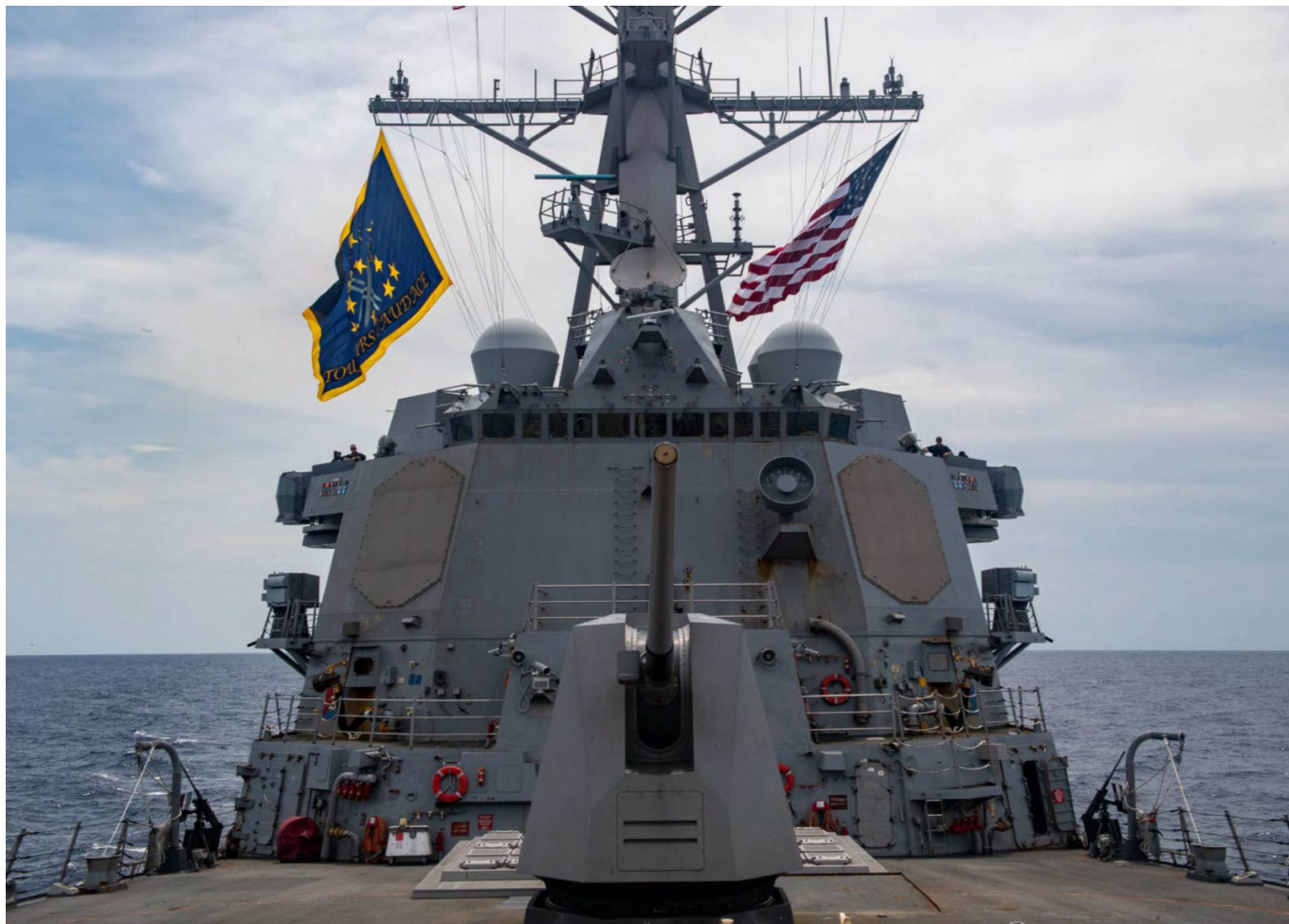
USS Mustin nahe der Paracel Inseln im Südchinesischen Meer 2020