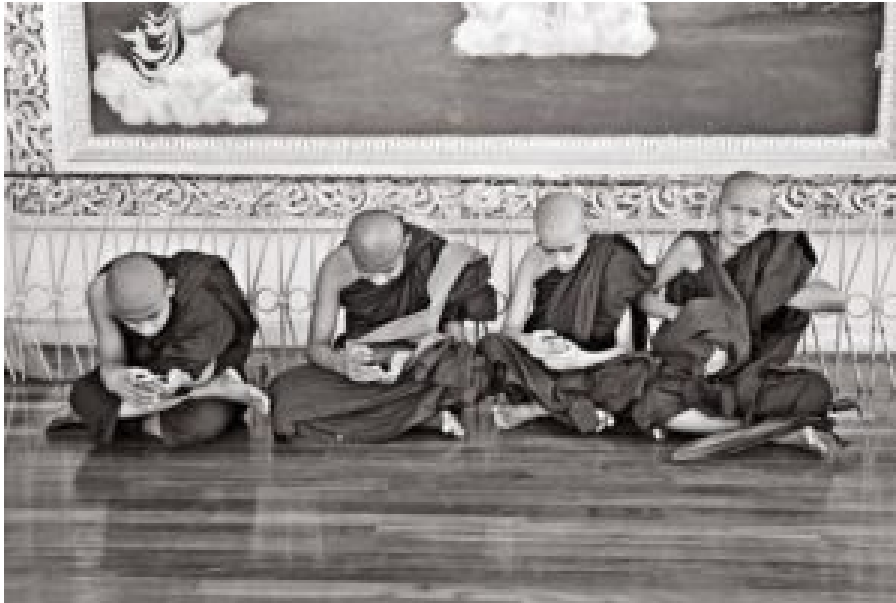
Junge Mönche in Myanmar verbringen Zeit am Handy.

„Das ist, was ich erreichen möchte: Etwas gegen den Konflikt tun und darüber hinaus eine Kultur des Friedens aufbauen, vor allem im immer wichtiger werdenden Raum der sozialen Medien.“ (Sanda, Pseudonym einer NGO-Mitarbeiterin, die anonym bleiben möchte)