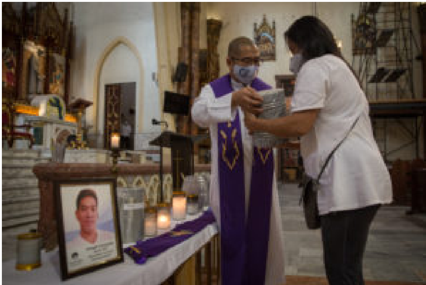
Übergabe der Urnen von Opfern an die hinterbliebenen Familien.