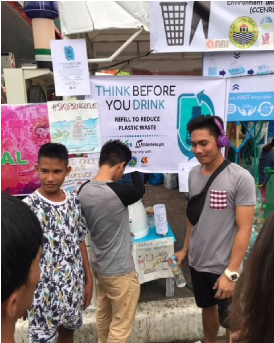
Zu schauer des Sinulog Festivals zapfen Wasser