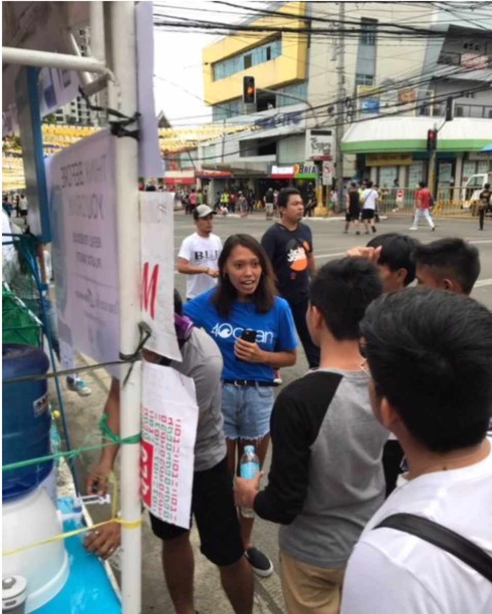
A ufklären über das philippinische Plastikmüllproblem