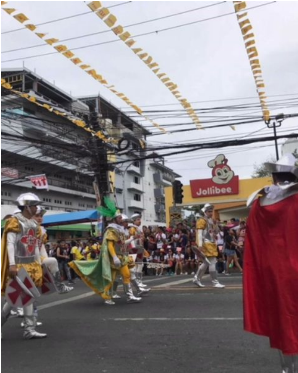
Pa rade beim Sinulog Festival