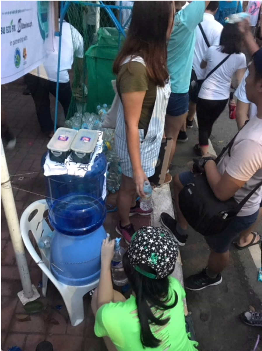
Wasserzapfen beim Stand der Sinulog Refill Revoultion