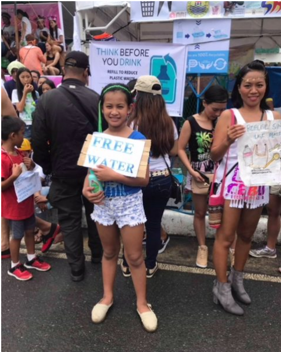
Mädchen beim Stand der Sinulog Refill Revolution