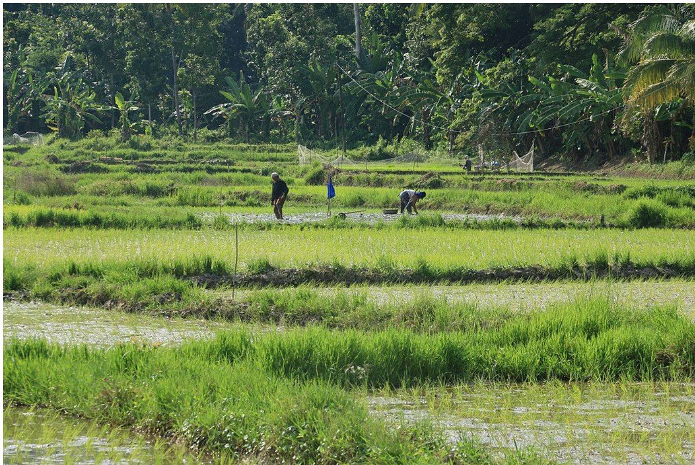
Reisfeld in Bohol, Philippinen