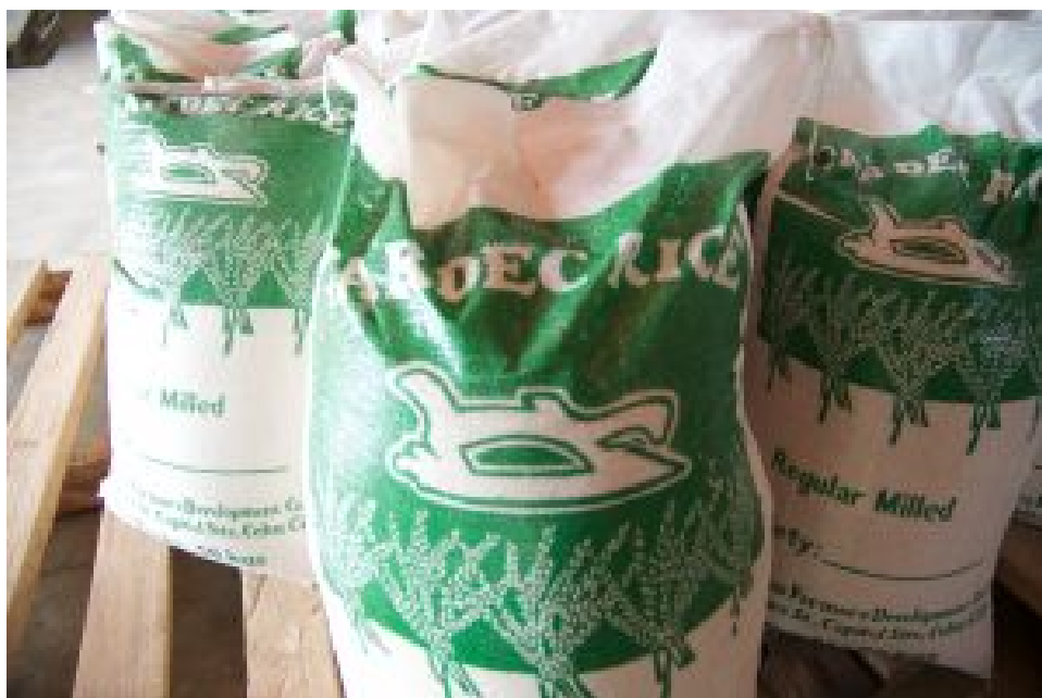
FARDEC Reis

Die Verhinderung von Reis-Kartellen und Monopolen scheint im aktuellen Szenario sehr unwahrscheinlich, da die derzeitige Regierung eher den Import von Reis unterstützt als den Aufbau lokaler Produktion. Dies liegt in der neoliberalen Politik der Welthandelsorganisation (WTO) begründet, die Einfluss auf die Politik der Philippinen hat. Wie kann ein Land des globalen Südens wie die Philippinen in einem kapitalistischen Spiel gegen Länder des globalen Nordens gewinnen? Wie soll eine kleine Initiative gegen Monopole ankommen, die in puncto Kapitalisierung und Rückhalt aus der Politik im Vorteil sind? Darüber hinaus sind die Probleme rund um die Bäuer*innen und ihre Land allgegenwärtig. Land Grabbing und die Verbreitung multi-nationaler Firmen sind Herausforderungen, die einer florierenden lokalen Produktion im Wege stehen.