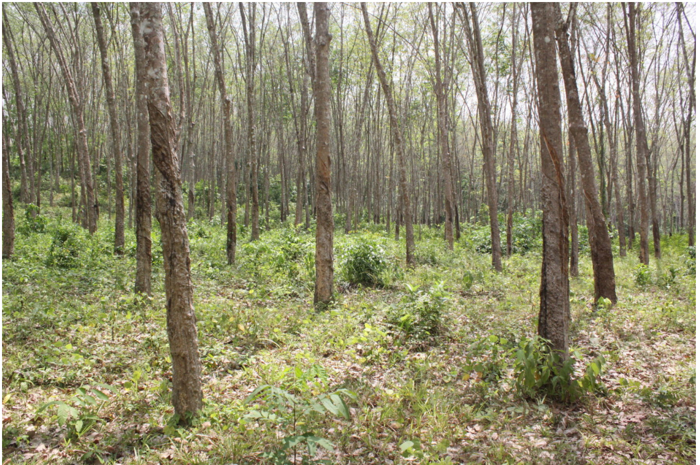
Monokultur in Thailand. Kautschuk-Plantage 2016

Ländliche Selbst- oder Regionalversorgungsstrukturen gehen verloren und weichen Monokulturen von Palmöl oder Mais sowie Massentierhaltung zum Beispiel von Geflügel oder Schweinen. Dies geht einher mit dem Anwachsen von Megastädten mit ihren slumartigen Auswüchsen sowie Desakotas [aus dem Indonesischen von desa = Dorf, kota = Stadt, d.R.], jenen Gebieten im Umland von Großstädten, wo sich urbane und landwirtschaftliche Nutzungs- und Siedlungsformen mischen, und dem damit einhergehenden zunehmenden menschlichen Vordringen in die verbliebenen artenreichen Naturlandschaften.