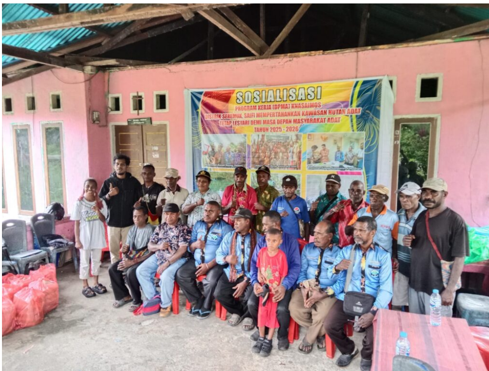
Treffen der indigenen Gemeinschaft der Knasimos zum Thema Waldschutz durch Ökotourismus.

Die Knasimos erkennen, dass der Schutz ihres angestammten Landes heute nicht mehr allein auf traditionellem Wissen beruhen kann. Dieses Wissen muss in eine Sprache übersetzt werden, die für staatliche Bürokratien verständlich ist. Daher stellt die Kartierung ihrer traditionellen Territorien einen entscheidenden Schritt dar. Gemeinsam mit unterstützenden Organisationen kartierten sie vierzehn Clangebiete. Der Prozess war partizipativ und bezog alle ein, einschließlich junger Menschen. Obwohl zeit- und kostenintensiv, wird er als langfristige Investition betrachtet.