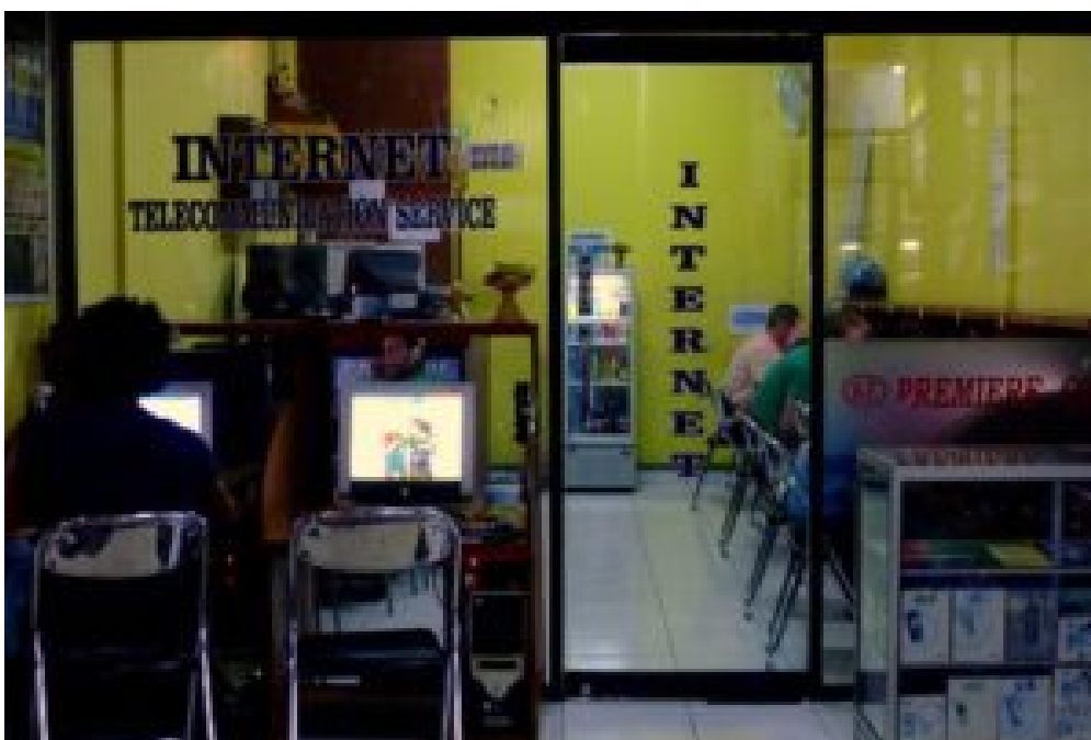
Ein Internet-Cafe auf der Insel Bali.

Meutya gab bekannt, dass alle offenen Fragen bezüglich des Gesetzesentwurfs bereits geklärt seien und das Gesetzgebungsverfahren nun in die letzte Phase einträte, nämlich die exakte Formulierung und Sicherstellung der Widerspruchsfreiheit mit bestehendem geltenden Recht. Meutya sagte auch, dass über die problematischen Punkte in Bezug auf personenbezogene Daten – ob von Privatwirtschaft, unabhängigen Institutionen oder Regierungsstellen gesammelt – im Arbeitsausschuss nun Einigung erzielt worden sei. Nähere Informationen dazu sind leider nicht erhältlich, da alle Sitzungen der Parlamentskommission mit der Regierung nicht öffentlich sind. Nach Medienberichten vereinbarten das Parlament und die Regierung, die Zustimmung des Präsidenten noch einzuholen.