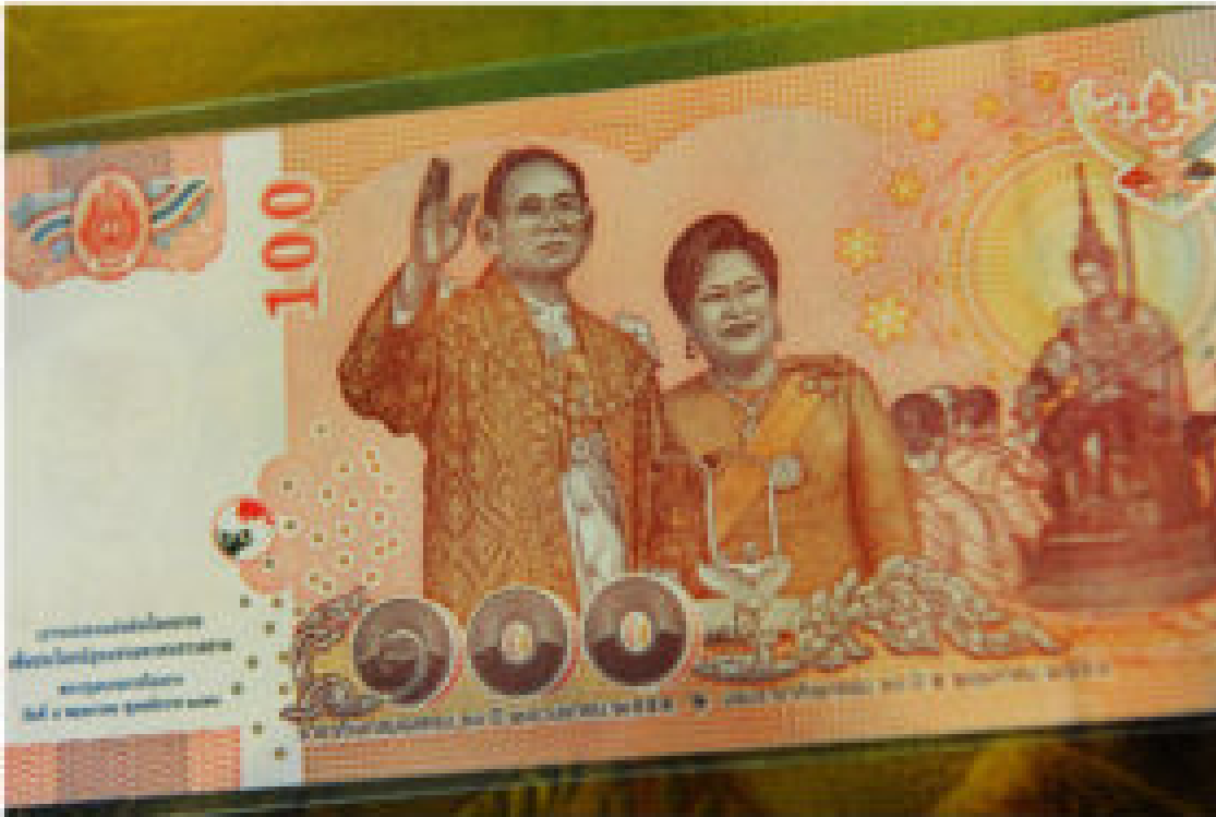
Ein 100-Baht Schein mit dem vorherige König Bhumipol mit Königin Sirikit Kitiyakara. Auf der Vorderseite der Geldscheinen müssen immer die Könige in Thailand abgebildet sein.

Das thailändische Königtum dehnte die ‚Rassengrenzen‘ auf die bestehenden territorialen Grenzen aus, so dass die gesamte Bevölkerung des Landes als Untertanen thailändisch wurde — eine Kombination aus Nation, Nationalität und Rasse. Prinz Damrong, der Innenminister, erklärte laut Streckfuss, sein Ziel sei es, „alle Menschen zu Thais zu machen, nicht zu Laoten oder Malaien“. Andere ethnische Völker wurden der thailändischen Rasse unterworfen, absorbiert und assimiliert: eine ‚Thaiisierung‘. Es gab keine laotischen Provinzen und kein laotisches Volk innerhalb der territorialen Grenzen mehr, da die herrschende Elite in Bangkok begann, die Laoten „ethnisch, historisch und demografisch aus Siam auszulöschen“. Der Mythos einer großen Thai-Rasse wurde geboren. Rasse und Nationalität verschmolzen miteinander und „subsumierten alle Menschen Thailands unter einem imaginären ‚Thai-Sein‘“.