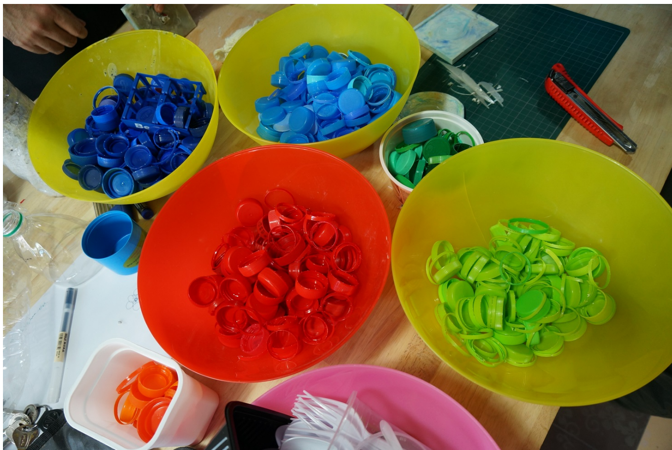
Yolo Plastikmüll Workshop: Bunte Flaschendeckel aus Plastik werden nach Farben sortiert, um sie zu recyceln

Thailand ist sich seines unnötig hohen Anteils an Einweg-Plastikabfällen bewusst, der laut dem Ministerium für Meeres- und Küstenressourcen jedes Jahr über 300 Todesfälle seltener Meerestiere verursacht. Die Regierung hat das jedoch nur langsam zum Handeln veranlasst. Während eine Gruppe von Verbrauchern schon vor fast einem Jahrzehnt angefangen hat, Einweg-Plastik abzulehnen, hat sich das Kabinett erst im April 2019 auf den Fahrplan 2018-2030 für Abfallmanagement geeinigt . Eingebracht wurde die Initiative vom Ministerium für natürliche Ressourcen und Umwelt. Der Fahrplan soll einerseits die Reduzierung von Einweg-Kunststoff fördern und zum anderen dazu beitragen umweltfreundlichere Alternativen zu finden.