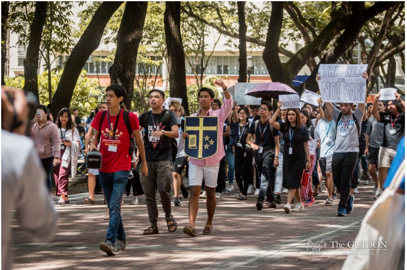
Studierende beim Protest auf dem Campus der Universität Ateneo de Manila.