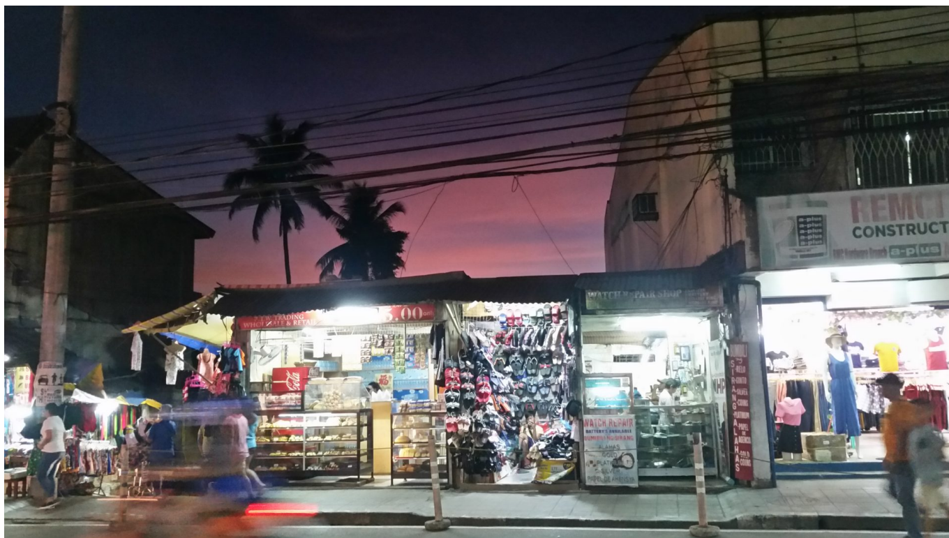
Nächtliches Shopping in den Philippinen

Wie vielfältig, lebendig aber auch brüchig die philippinische Zivilgesellschaft an vielen Stellen ist, wird im Buch insgesamt sehr deutlich, auch, wo sie noch mehr solidarische Unterstützung gebrauchen könnte. Dort, wo Unterstützung von einem korrupten Staatsapparat oftmals verwehrt bleibt, erkennt man nichtsdestotrotz Hoffnungsschimmer, die Mut machen, auch als Außenstehender genauer hinzuschauen und sich zu engagieren!