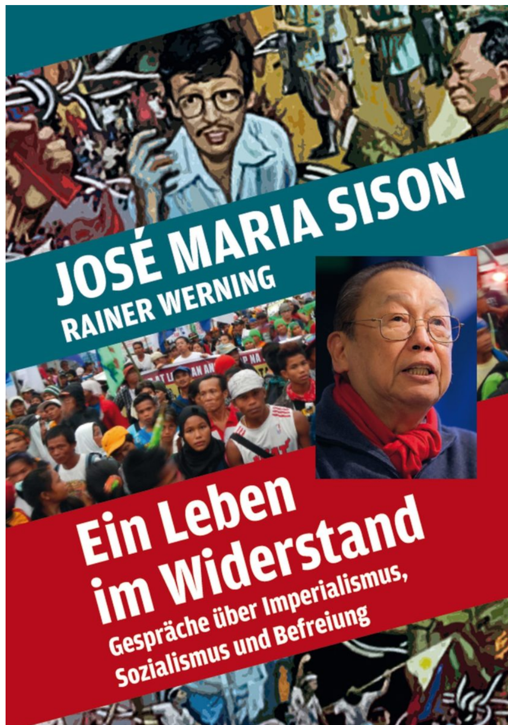
Buchcover von „Ein Leben im Widerstand“

Über die charakteristischen Schikanen hinaus werden die Untergrundlinke und ihre Massenbasis weiterhin vom Staat gejagt, der derzeit von der Herrschaftsclique Rodrigo Duterte angeführt wird und 125.000 Soldaten und Tausende von Polizeikräften gegen sie ins Feld führt. Sieben Präsidenten, von Marcos in den 1960er Jahren bis Duterte heute, haben groß angelegte und von den USA unterstützte Einkesselungs- und Unterdrückungskampagnen gegen die Sozialrevolutionäre durchgeführt, wobei jeder militärische Stabschef damit prahlte, dass die maoistische Neue Volksarmee (NPA) vernichtet werden würde.