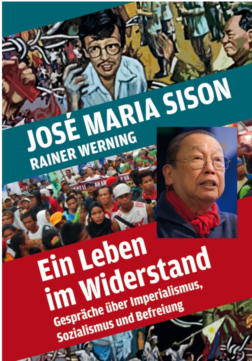
Buchcover von „Ein Leben im Widerstand“

Über die charakteristischen Schikanen hinaus werden die Untergrundlinke und ihre Massenbasis weiterhin vom Staat gejagt, der derzeit von der Herrschaftsclique Rodrigo Duterte angeführt wird und 125.000 Soldaten und Tausende von Polizeikräften gegen sie ins Feld führt. Sieben Präsidenten, von Marcos in den 1960er Jahren bis Duterte heute, haben groß angelegte und von den USA unterstützte Einkesselungs- und Unterdrückungskampagnen gegen die Sozialrevolutionäre durchgeführt, wobei jeder militärische Stabschef damit prahlte, dass die maoistische Neue Volksarmee (NPA) vernichtet werden würde.