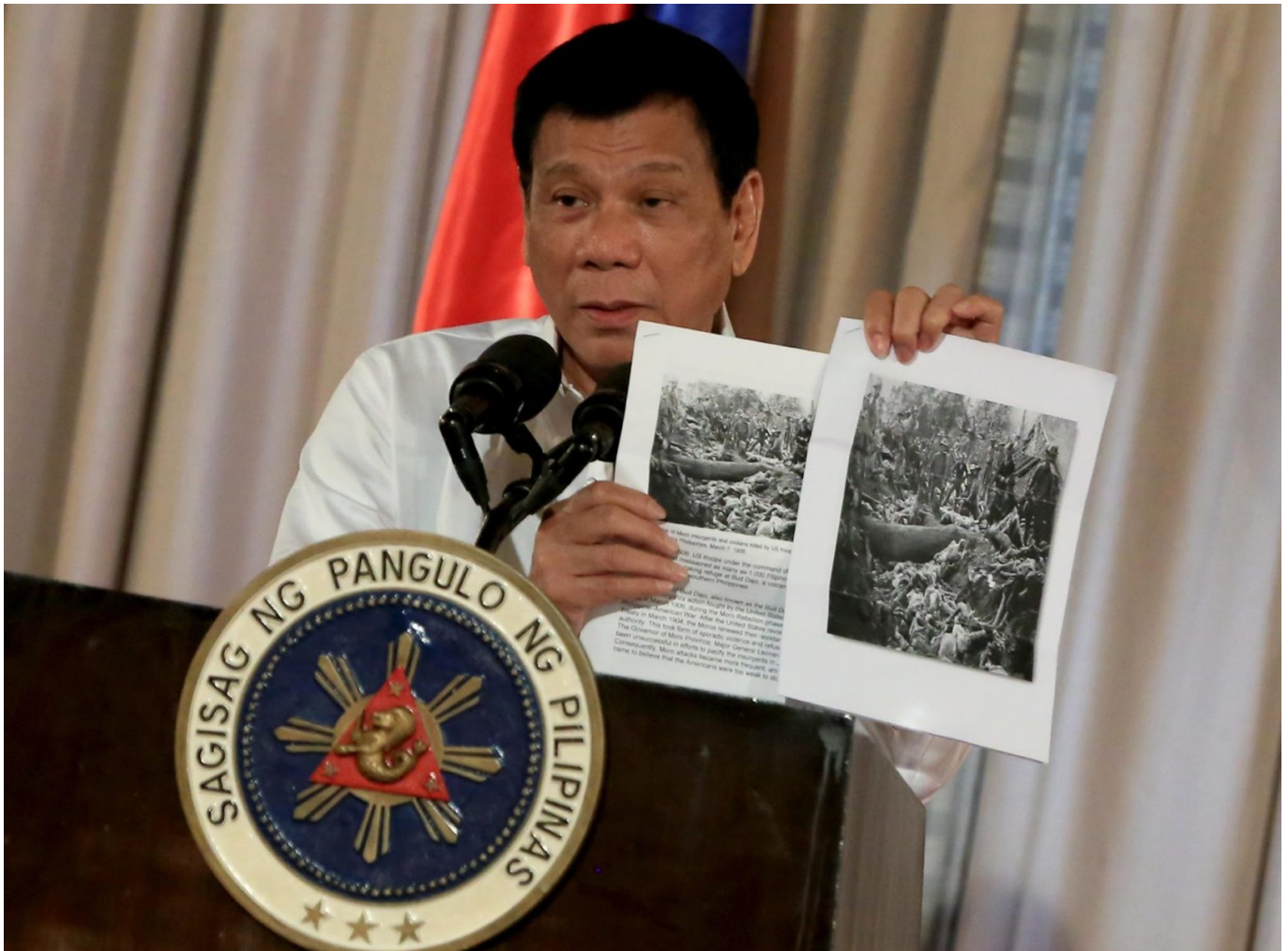
Präsident Duterte zeigt Bilder des Massakers von Bud Dajo, einem der blutigsten Konflikte des Philippinisch-Amerikanischen Krieges.