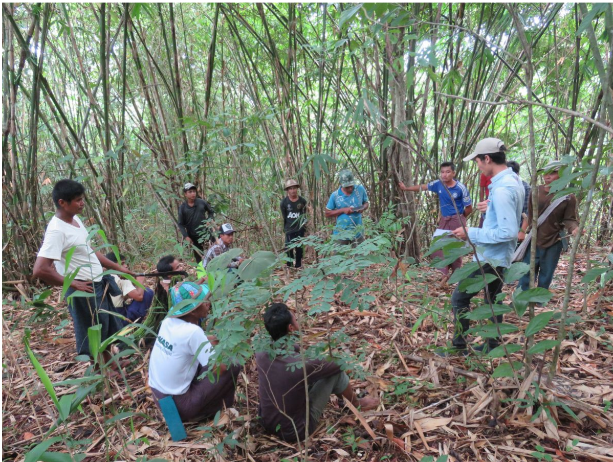
Community Forest

Dabei hat Myanmar schon jetzt die mit Abstand am stärksten verschmutzte Luft in Südostasien, Tendenz steigend. Sie gehört zu den größten Risikofaktoren für frühzeitige Sterblichkeit. Seit 2017 hat sie zu schätzungsweise über 45.000 Todesfällen landesweit beigetragen. Im Zuge der Demokratisierung seit 2011 kam es zu schnellen wirtschaftlichen Entwicklungen, gerade in urbanen Räumen. Die städtische Bevölkerung wächst exponentiell aufgrund von Landflucht, doch die Flächen sind begrenzt. Mehr als 80 Prozent der Stadtbevölkerung kocht mit Festbrennstoffen. Die Neuregistrierungen für Kraftfahrzeuge haben sich in den letzten fünf Jahren verdoppelt. Industrien rund um Städte sprießen aus dem Boden und der Bau neuer Industriezonen wird von der Regierung massiv gefördert.