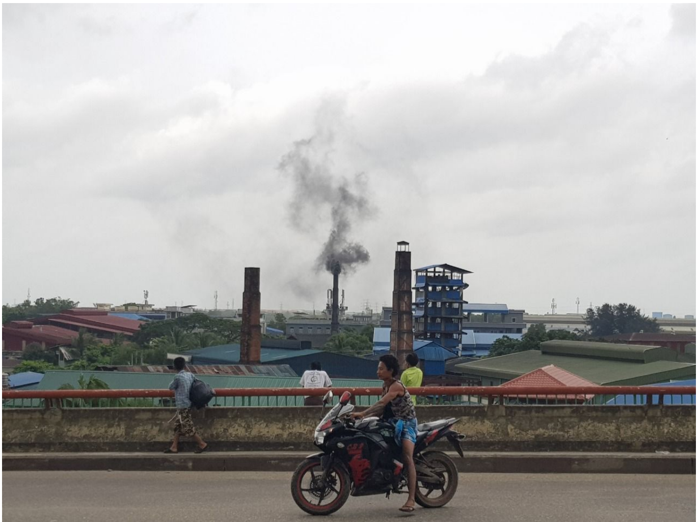
Industrielle Kohlenutzung in Yangon

Myanmar: Naturkatastrophen der letzten zwei Jahrzehnte zeigen die Sensibilität des Landes für die Folgen des Klimawandels. Die Regierung will den Weg zu einer klimaresistenten und kohlenstoffarmen Gesellschaft ebnen, setzt jedoch weiterhin auf Kohle zur Energieversorgung.