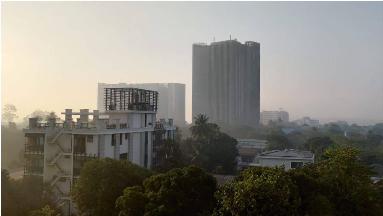
Morgendlicher Smog über den Dächern Yangons

schlecht vorbereitet. Das liegt nicht zuletzt an fehlendem finanziellem Budget zur Förderung von Anpassungsmaßnahmen. Der direkte Zugang zu internationalen Klimatöpfen durch nationale Einrichtungen ist gerade für die am meisten betroffenen Länder extrem begrenzt.