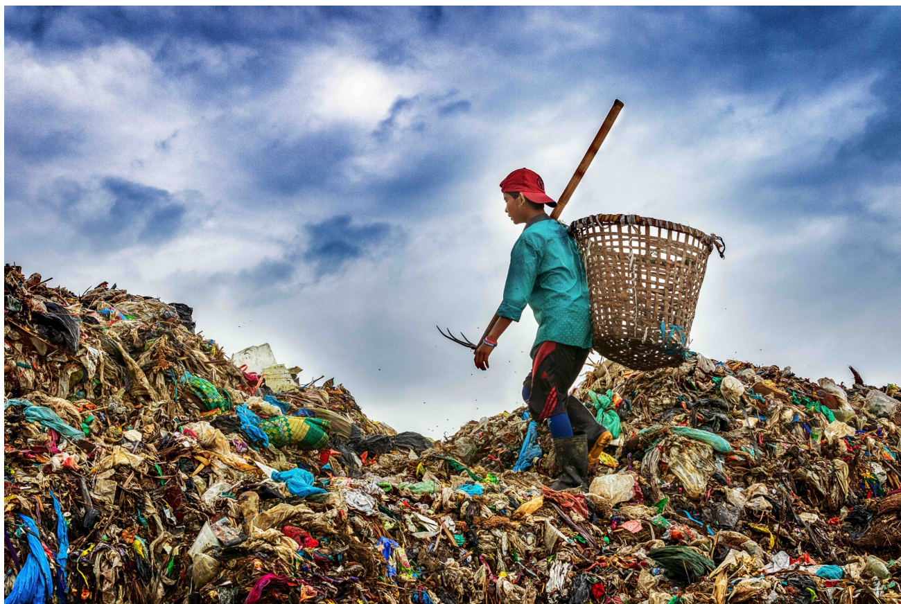
Müllsammler in der Insein Deponie