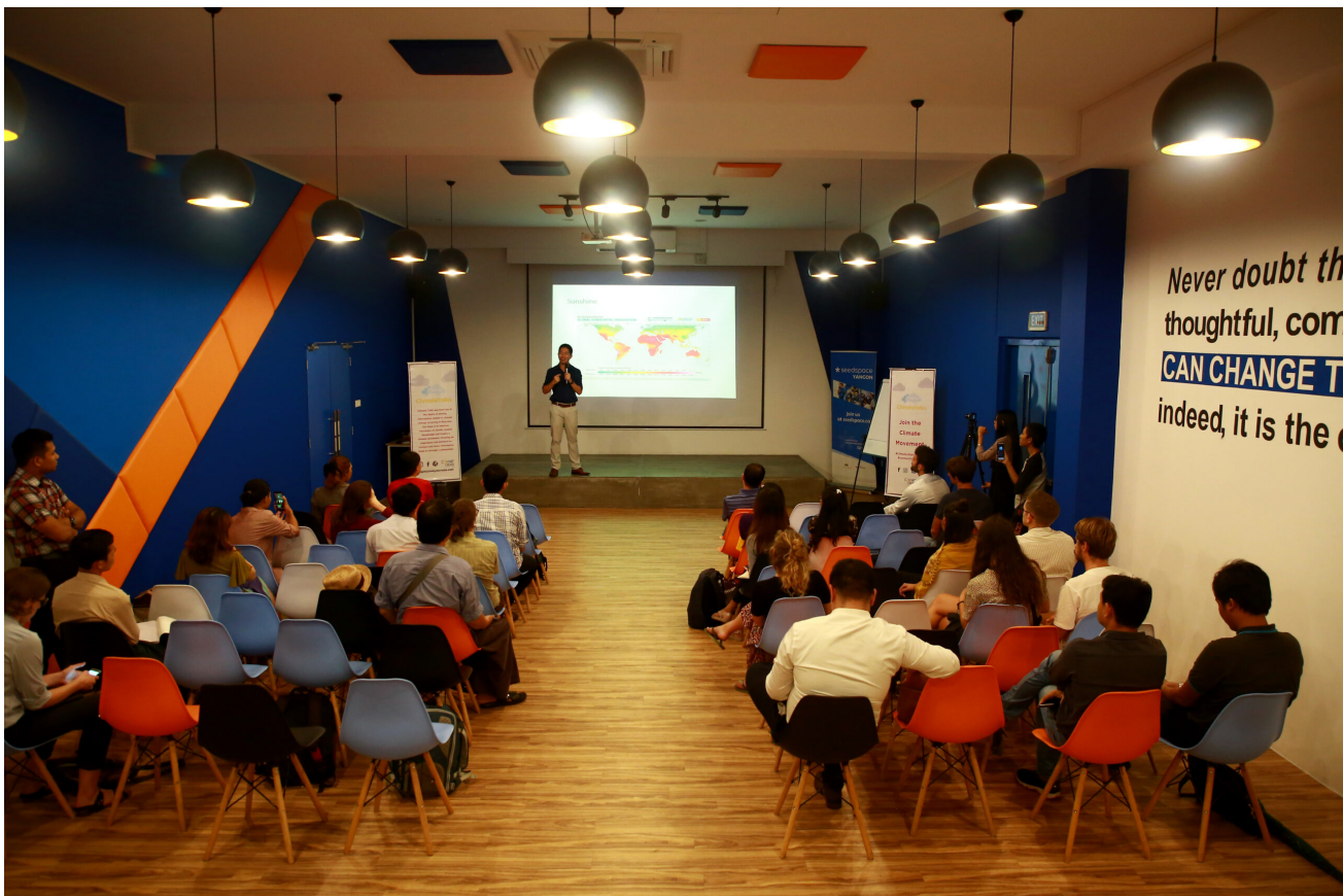
Eindrücke von einem Climate Talk, Veranstaltungsort Seedspace, Yangon 2019