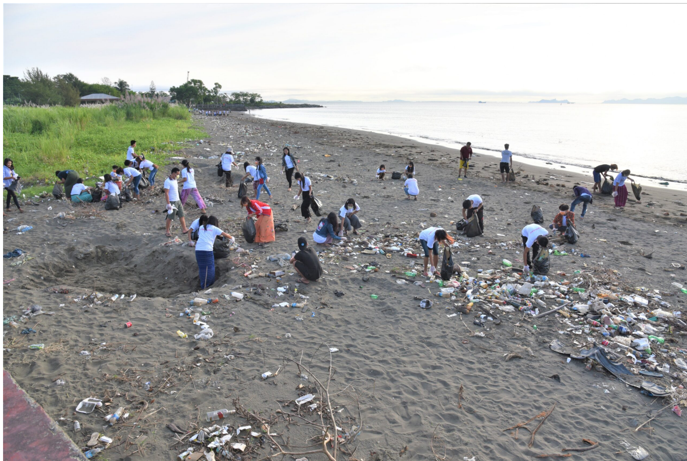
Studierende säubern den Strand von Plastikmüll in Sittwe im Rakhine Staat

Der Privatsektor spielt eine große Rolle, aber auch die Politik. Die ethnischen Staaten Myanmars, die besonders anfällig für die Auswirkungen des Klimawandels sind, sind auch politisch umkämpft. Wie kann man Eurer Meinung nach hier effektiv gegen den Klimawandel vorgehen und Klimaschutzmaßnahmen umsetzen?