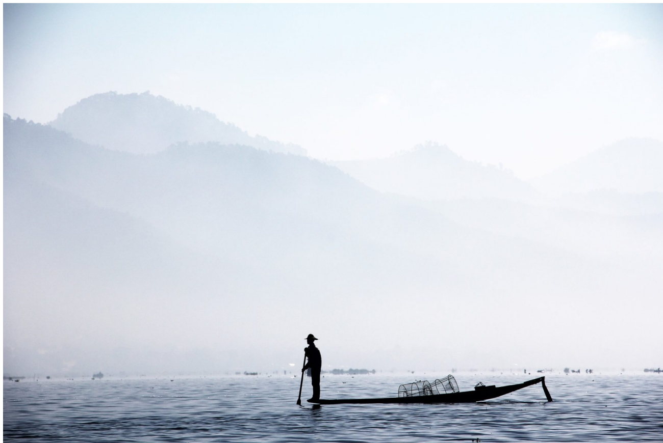
Mann in einem Fischerboot, 2011