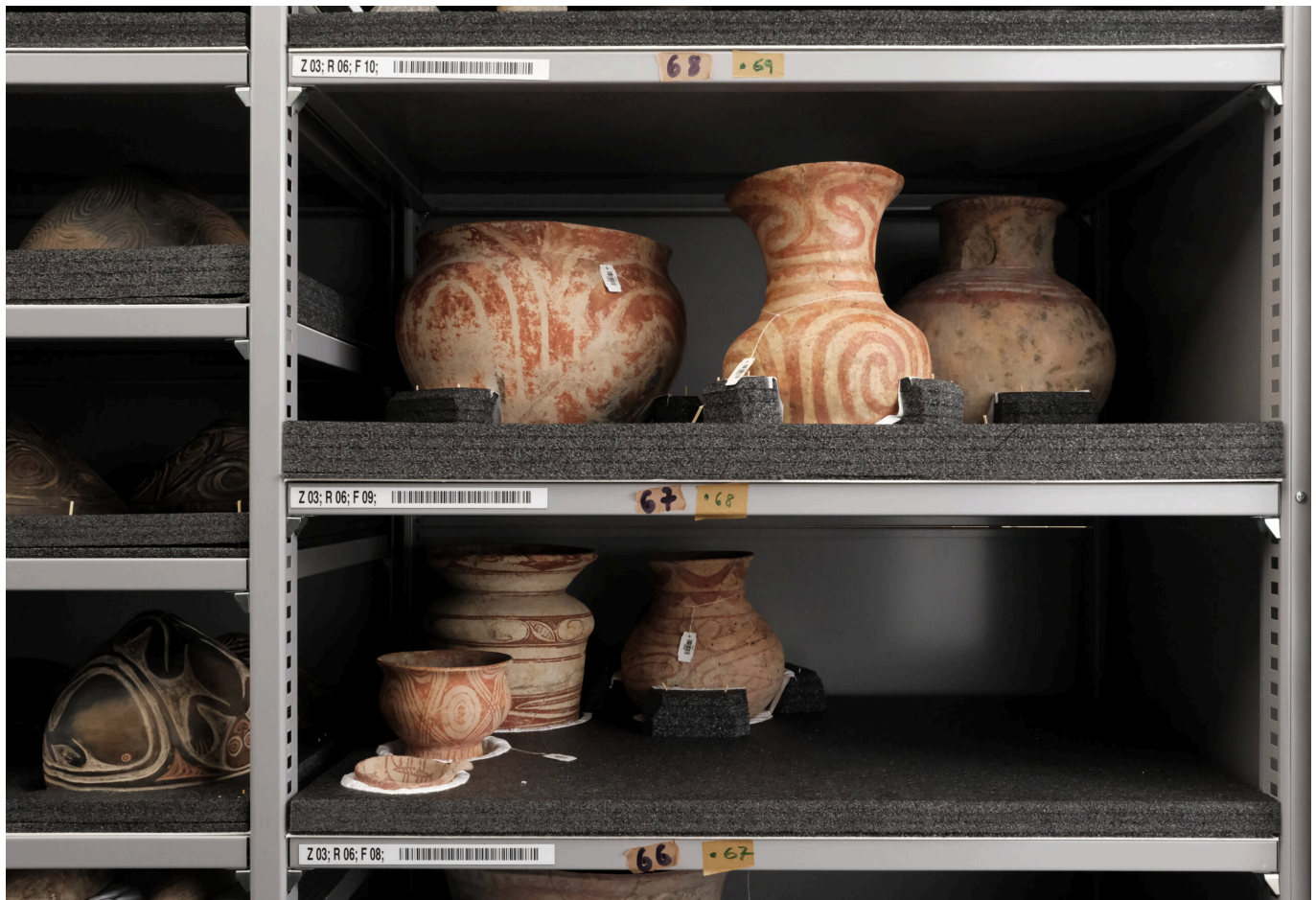
Ban Chiang-Keramiken im Steindepot des RJM.