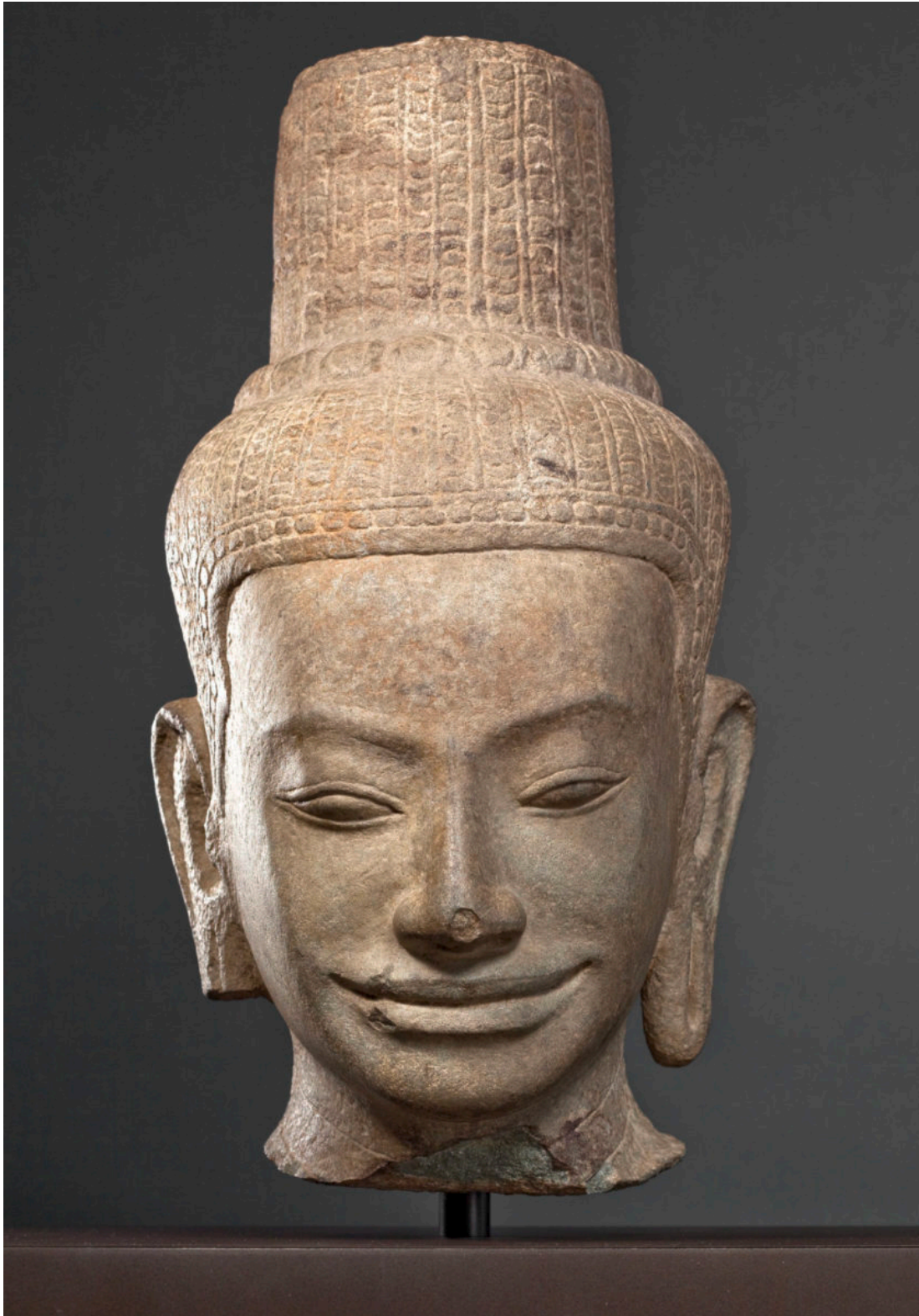
Vishnu-Kopf aus dem Prasat Bakong, Angkor, Kambodscha im Bayon-Stil (1181-1200), RJM 51587.