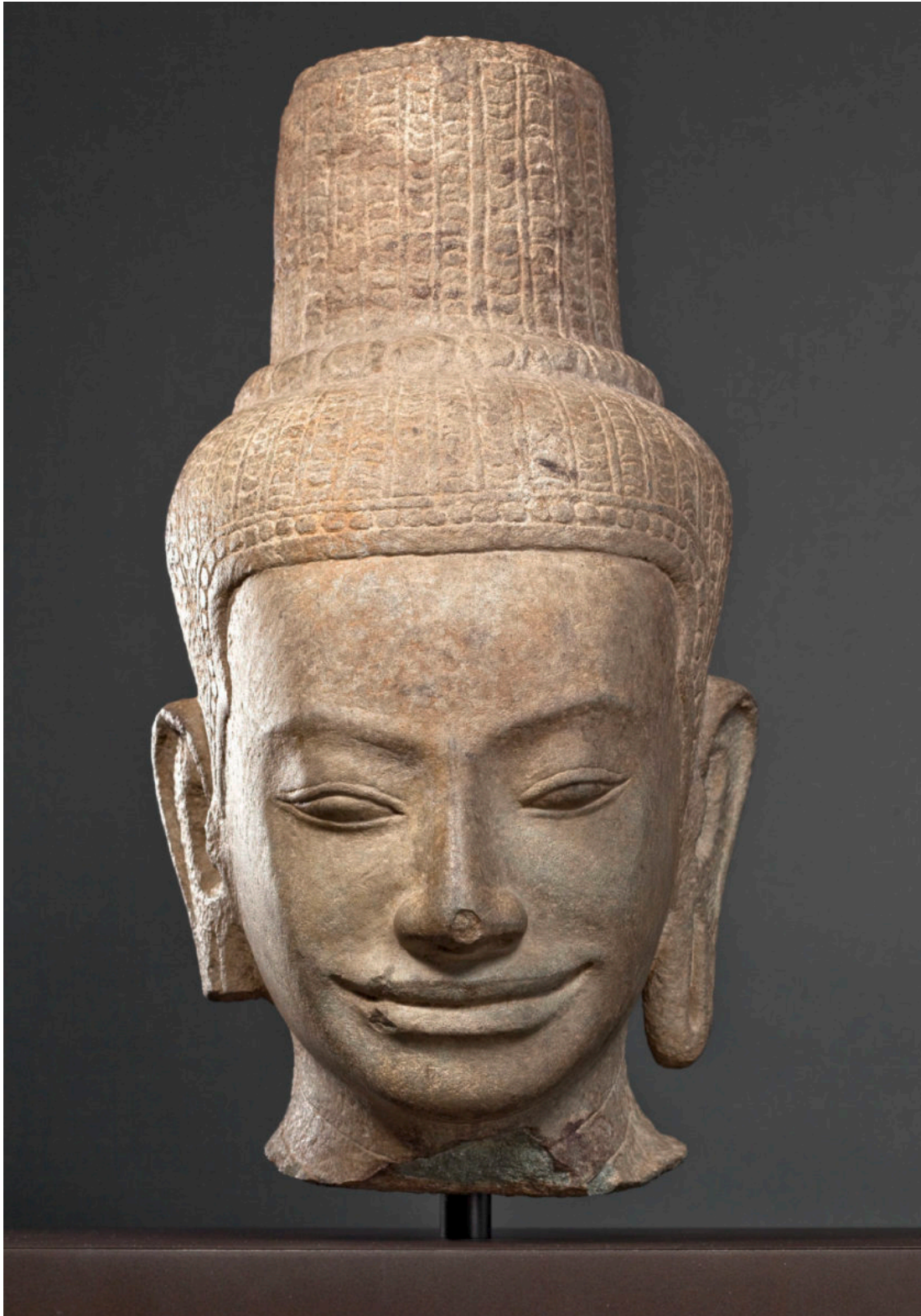
Vishnu-Kopf aus dem Prasat Bakong, Angkor, Kambodscha im Bayon-Stil (1181-1200), RJM 51587.