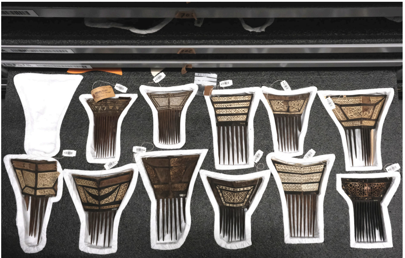
Zierkämmen vom Babar- und Tanimbar-Archipel, Südliche Molukken, Indonesien, im Depot des RJM.

Deutschland: Die Sammlungen des Rautenstrauch-Joest-Museums (RJM) in Köln umfassen rund 10.000 Objekte aus Südostasien. Mehr als die Hälfte wurden während der Kolonialzeit erworben. Museumsmitarbeiter*innen geben Einblicke in die (selbst-)kritische Aufarbeitung der kolonialen Verflechtungen des RJM.