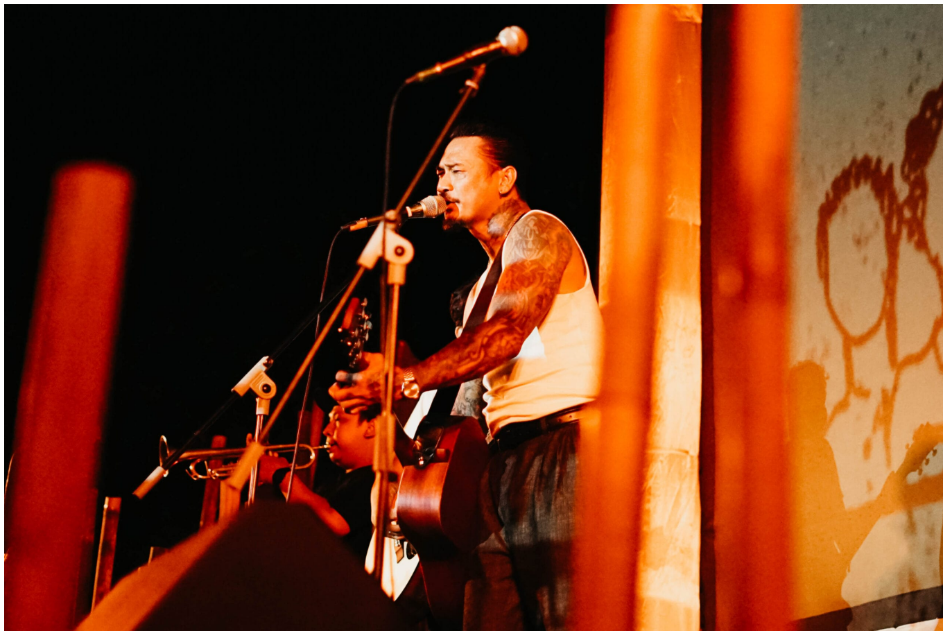
Konzert zum Album Prison Songs 2018 in Bali

Sukarno hatte der populären westlichen Musik den Kampf angesagt, indem er Verbote erließ und die Besinnung auf lokale Volkslieder und das Kreieren von revolutionären Hymnen und Märschen unterstützte. Dieses Ziel verfolgte auch die Künstlervereinigung Lekra ( Lembaga Kebudayaan Rakyat = Institut für Volkskultur ), die der kommunistischen Partei nahe stand und bei der auch Subronto Mitglied war. Lekra setzte sich für eine Fortsetzung der Revolution mit künstlerischen Mitteln ein und protestierte gegen den wachsenden Einfluss westlicher Musik, Literatur und Filme, die als Ausdruck von Imperialismus und Neokolonialismus verstanden wurden. Lekras künstlerisches Leitbild war eine Kunst mit dem Volk und für das Volk. Lekra-Künstler*innen lebten oft monatelang in Dörfern mit der dortigen Bevölkerung, um lokale Kunstformen zu studieren und gemeinsam mit den Bewohnern zur Aufführung zu bringen.