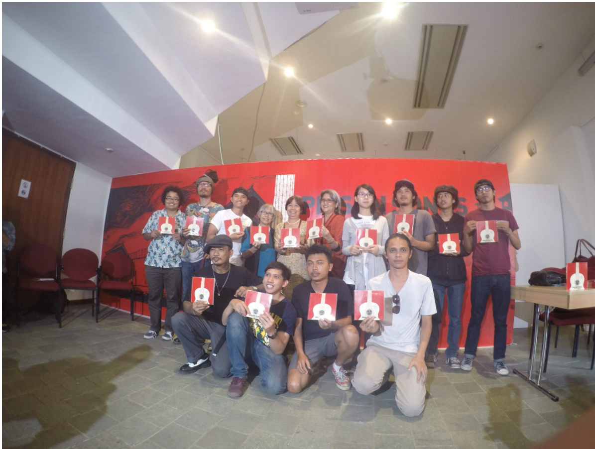
Launch des Albums Prison Songs 2015 in Jakarta