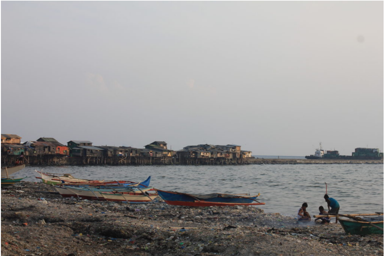
Leben im Junkshop - Alltag eines Müllsammlers in Quezon City

Philippinen - Zwar erließ die Regierung vor fast 20 Jahren ein umfassendes Abfallwirtschaftsgesetz, doch die Umsetzung verläuft lokal sehr verschieden. Informelle Müllsammler*innen besorgen den Großteil der Müllentsorgung. Immerhin gibt es inzwischen in über 20 Städten Plastikverbote.