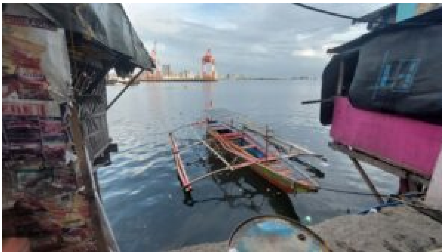
Blick vom Barangay Baseco Compound im Hafendistrikt Metro Manilas

Der Konflikt um die gegensätzlichen Ansprüche auf das Westphilippinische Meer wird nicht zuletzt mit dem Einsatz von Fischerbooten, staatlichen Patrouillen und wiederholten Zusammenstößen geführt. Zuletzt bezichtigte die chinesische Küstenwache am 22. Februar ein Boot des Bureau of Fisheries and Aquatic Resources (BFAR) des „illegalen Eintritts“ in chinesische Gewässer. Die philippinische Küstenwache widersprach. Bereits einen Monat zuvor hatten die Philippinen angekündigt, ihre Außenposten mit Unterstützung der US-Marine im Westphilippinischen Meer auszubauen.