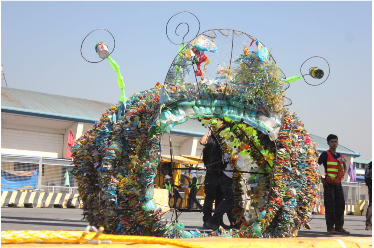
Break free from Plastic: International in Bewegung gegen Plastikverschmutzung

Südostasien /Europa: Greenpeace Philippines und Greenpeace International sind Teil der ‚Break Free From Plastic‘ Bewegung. Das Ziel ist, auf die weltweite Umweltverschmutzung durch Plastik aufmerksam zu machen. Im Interview berichtet Manfred Santen, Chemieexperte bei Greenpeace Deutschland, von ‚Plastikmonstern‘ und deren Auswirkungen.