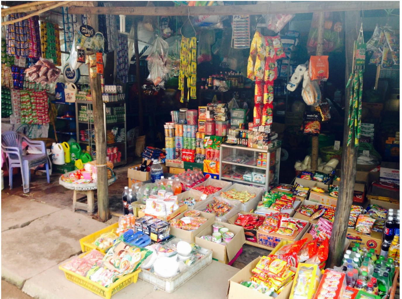
Reichlich Plastik im Angebot: Ein typischer Gemischtwarenladen in Vietnam

politischen Verantwortlichen das Problem erkannt haben. Hier auf der Insel – vielleicht anders als anderswo – liegt das fehlende Engagement der Entscheidungsträger*innen nicht am fehlenden Bewusstsein. Es ist fehlende Macht – zumindest gefühlt fehlende Macht –, die sie zurückhält. Sie erklären, dass die Entscheidungsbefugnis auf Provinzebene liegt und nicht im Bezirk Phu Quoc. Dabei gibt es andere Beispiele vom Festland. In der zentralvietnamesischen Küstenstadt Hoi An sind nämlich lokale Behörden selbst aktiv geworden. ‚Hoi An sagt nein zu Plastiktüten‘ ist der Slogan ihrer Kampagne. Aber klar, das braucht viel Zeit und Engagement. Ich hoffe, dass das Kreis-Volkskomitee von Phu Quoc bald mehr Initiative ergreift und dem Rest Vietnams zeigen wird, dass sie Phu Quoc vom Müll befreien können.