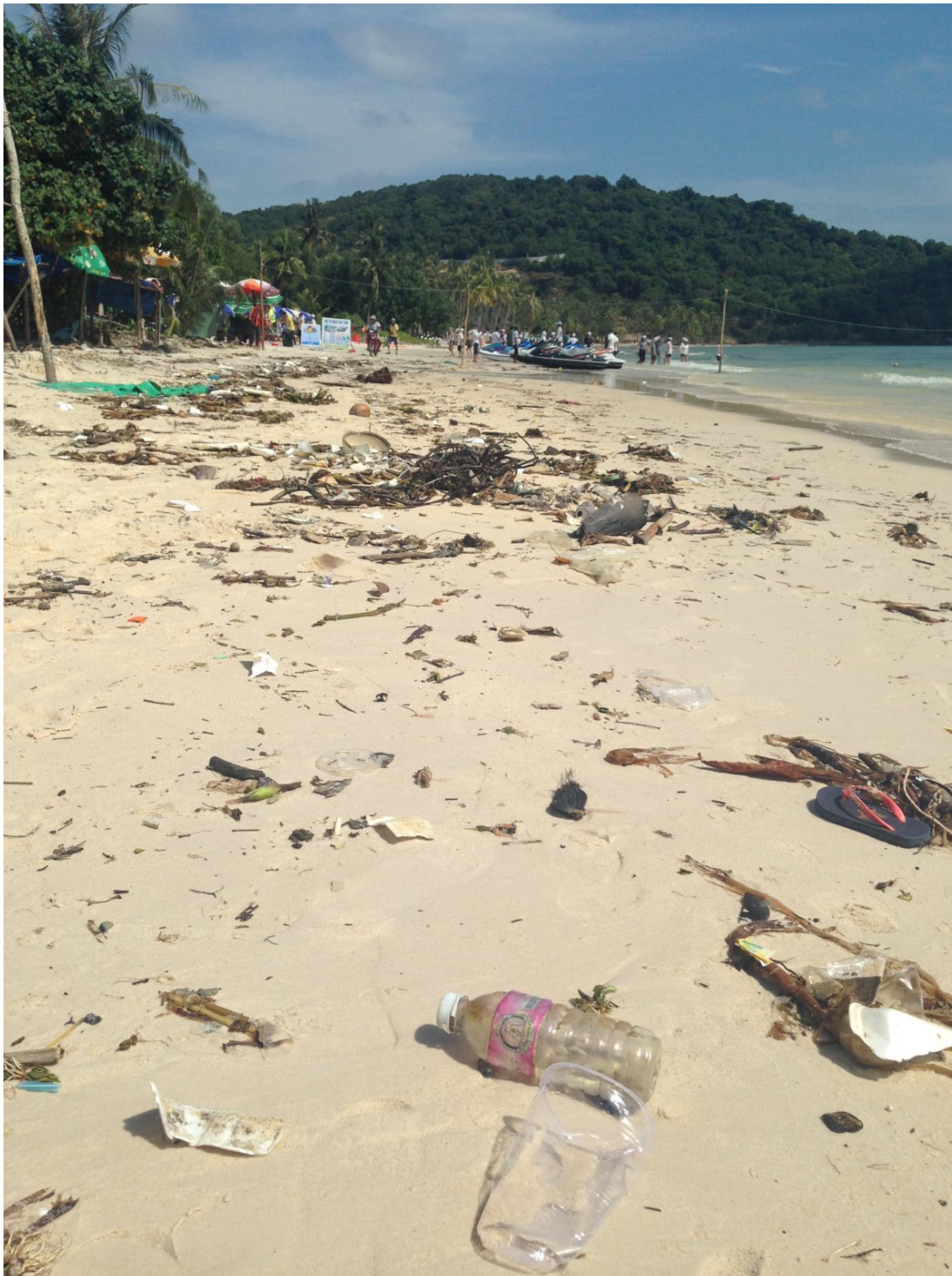
Am Sao Beach in Vietnam liegt überall Plastikmüll herum

Ngoc: Die Initiative Phu Quoc Clean and Green zielt darauf ab, Bewusstsein zu schaffen, Wissen zu vermitteln und Verhaltensänderungen herbeizuführen. Wir wollen den Menschen ein besseres Verständnis ihrer Umwelt vermitteln und sie ermutigen weniger Plastik zu konsumieren. Unsere Aktivitäten beinhalten vor allem die Organisation von Abfallsammelaktionen auf der ganzen Insel. Jetzt wollen wir die Initiative aber noch weiter entwickeln. Jedes Wochenende führen wir Abfallsammelaktionen an denselben Orten durch, um die Orte sauber und schön zu machen. Zurzeit planen wir gerade ein großes Event für den Tag der Erde am 29. März. Des Weiteren haben wir einen Abfallsammelwettbewerb lanciert. Die Freiwilligen nehmen vor und nach der Aufräumaktion Fotos auf. Diese werden dann auf Facebook gepostet. Belohnt wird der Post mit den meisten ‚likes‘.