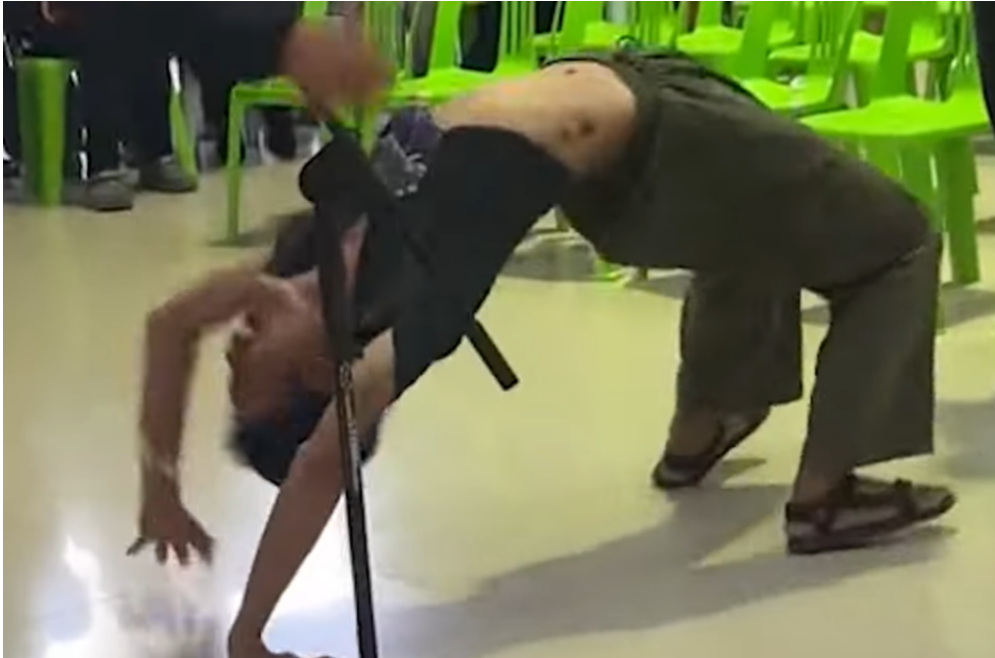
Jubelpose nach dem Ziehen der befreienden Karte.

Andererseits ist die vordergründige Unbeschwertheit der Veranstaltung für das thailändische Militär strategisch vorteilhaft, da sie die Gewalt verschleiern, die hinter verschlossenen Türen stattfindet, sobald die Wehrpflichtigen eingezogen wurden. Dies erklärt, warum Soldaten bereitwillig an den Späßen der potenziellen Rekruten:innen teilnehmen.