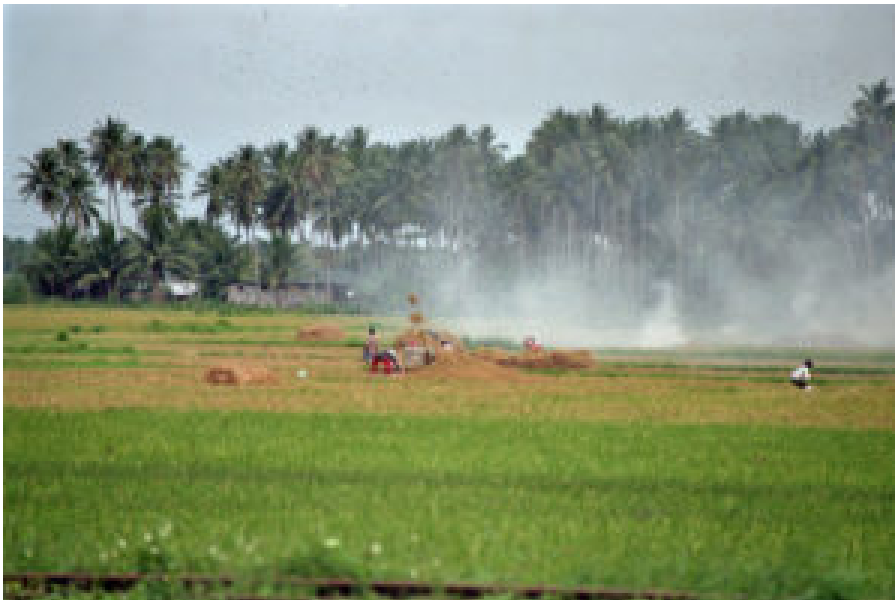
Reisernte in der Provinz Quezon. Ernteabfälle werden verbrannt.

Viel Aufmerksamkeit wird dem Thema „Innovation für die Zukunft der Landwirtschaft“ gewidmet, etwa neue Technologien, das Internet der Dinge, künstliche Intelligenz oder Digitalisierung. Dahin