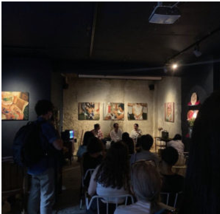
The First Batch Kunstausstellung über die ersten philippinischen Krankenschwestern in Wien.

GR: Mich hat schon immer die künstlerische Seite der Dinge angezogen. Mein Leben ist sehr viel eine Reise innerhalb der Kunst. Ich ging zur Modeschule, um Designer zu werden und ich habe in der Kreativindustrie mehrere Jahre gearbeitet. Selbst nachdem ich den Designbereich schließlich verließ und meine Karriere in Richtung Kommunikation verlagerte, fand ich mich in der zeitgenössischen Kunst wieder. Kunst ist einfach in meiner DNA.