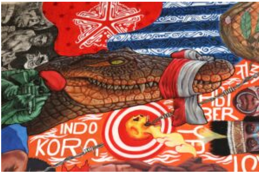
The Timako Woo Chronicle (Ausschnitt), 2023. © Marion Struck-Garbe

Udeido hat Anschauungen wie diese aufgenommen. Ähnlichkeiten zwischen Krokodilen und den indigenen Völkern Papuas bestehen ihres Erachtens tatsächlich: beide werden gejagt und müssen sich verstecken. Die Morgensternflagge am oberen Bildrand bezieht sich explizit auf eine Episode des Mythos um Manarmakeri . Die Fahne wurde erstmals 1942 gehisst, während eines Koreri -Aufstands zur Zeit der japanischen Invasion und des Zusammenbruchs des niederländischen Kolonialregimes. Seitdem repräsentiert sie den Traum von Unabhängigkeit, Freiheit und Frieden. Sie symbolisiert den Widerstand schlechthin. Das öffentliche Zeigen der Morgensternflagge ist heute überall in Indonesien verboten und kann mit bis zu 15 Jahren Haft bestraft werden.