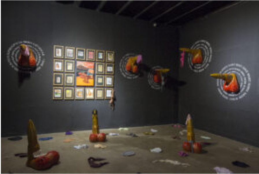
Betty Adii: Dystopian Reality: The Agony of Existence , 2021 raumgroße Installation.

bekommen. Aus Scham und Angst sprechen viele Opfer nicht über die an ihnen begangene Gewalt .