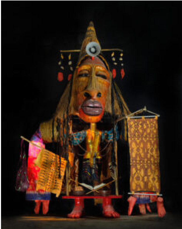
A Little Gate to Koreri , 2023, Dicky Takndare - Mixed Media.

Koreri entstand einst als messianische Bewegung in der Region um Biak im Norden des Landes. Als Ursprung gelten Schilderungen zu einer Ahnengestalt namens Manarmakeri , der nachgesagt wurde, zu wissen wie die Menschen 'glücklich bis ans Ende ihrer Tage' leben können. Doch ihre Weisheiten und die Predigten von Anhängern wurden nicht ernst genommen und so reiste das sagemumwobene Wesen verärgert ab, das Geheimnis von Koreri mit sich nehmend. Es soll jedoch dem Volk von Biak versprochen haben, zurückzukehren, um Unabhängigkeit, Wohlstand und ein neues Leben zu bringen.