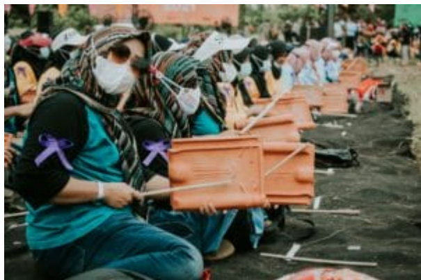
Keramik-Musikfestival der Jatiwangi Art Factory , 2021.

Jatiwangi Art Factory (JaF), ein 2005 ebenfalls in Indonesien gegründetes Kollektiv, untersucht, wie zeitgenössische Kunst und kulturelle Praktiken mit dem lokalen Leben in ländlichen Gebieten kontextualisiert werden können. Mit ihrem Projekt Kota Terakota (Die Terrakota-Stadt) markierte JaF im Jahr 2005 einen Neubeginn für Jatiwangi und seine Bewohner*innen. Mit Bezug zur Geschichte Jatiwangis in Westjava, wo zu Beginn des zwanzigsten Jahrhunderts durch den Abbau von Ton die größte Ziegelindustrie Südostasiens entstand, ermutigten sie Bewohner*innen, gemeinsam mit JaF diesen Ton zu nutzen, um Kunst und Kultur zu erschaffen und ein kollektives Bewusstsein und eine gemeinsame Identität zu entwickeln.