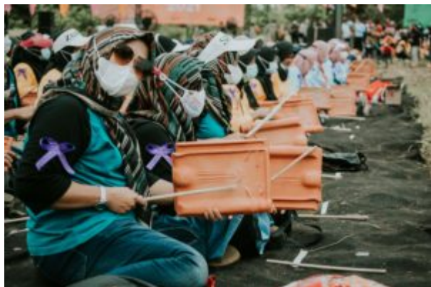
Keramik-Musikfestival der Jatiwangi Art Factory, 2021.

Jatiwangi Art Factory (JaF), ein 2005 ebenfalls in Indonesien gegründetes Kollektiv, untersucht, wie zeitgenössische Kunst und kulturelle Praktiken mit dem lokalen Leben in ländlichen Gebieten kontextualisiert werden können. Mit ihrem Projekt Kota Terakota (Die Terrakota-Stadt) markierte JaF im Jahr 2005 einen Neubeginn für Jatiwangi und seine Bewohner*innen. Mit Bezug zur Geschichte Jatiwangis in Westjava, wo zu Beginn des zwanzigsten Jahrhunderts durch den Abbau von Ton die größte Ziegelindustrie Südostasiens entstand, ermutigten sie Bewohner*innen, gemeinsam mit JaF diesen Ton zu nutzen, um Kunst und Kultur zu erschaffen und ein kollektives Bewusstsein und eine gemeinsame Identität zu entwickeln.