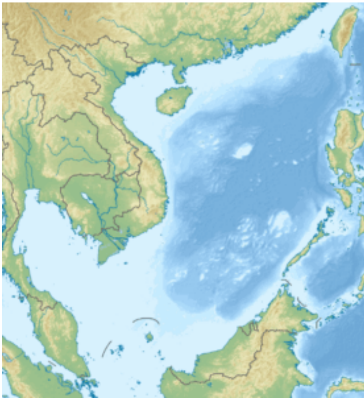
Reliefkarte Südostasiens mit dem Südchinesischen Meer im Zentrum

Die Fischereirechte der Anrainerstaaten sind umstritten. Insbesondere stimmt die Auslegung der 200-Meilen-Wirtschaftszone nicht mit dem 1994 in Kraft getretenen UN-Seerechtsübereinkommen überein bzw. wird nicht anerkannt.