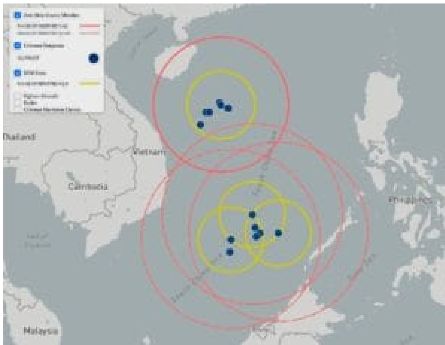
Chinesische Vorposten im umstrittenen Gebiet des Südchinesischen Meeres.

Taiwan hat eine Insel der Spratly-Gruppe - Itu Aba oder Taiping-Insel - 1.500 km südlich vom eigenen Staatsgebiet besetzt. Mit 1.300 m Länge und 365 m Breite besteht sie praktisch aus einer Landebahn mit einigen Wohnhäusern für Angehörige der Küstenwacht und einige wenige Zivilisten. Wie die Volksrepublik China beansprucht Taiwan (Republic of China) die Paracel- sowie die Spratly-Inseln.