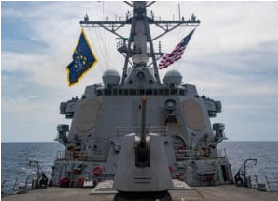
USS Mustin nahe den Paracel-Inseln im Südchinesischen Meer 2020

Die Analyse Southeast Asian Military Powers Ranked (2025) von Globalfirepower sieht Indonesien in der Rangliste an erster Stelle in Südostasien (15. weltweit), gefolgt von Vietnam (23.), Thailand (25.), Singapur (29.), den Philippinen (41.), Malaysia (42.) und Kambodscha (95.). Zum Vergleich: Deutschland belegt weltweit Rang 14. Weitere Daten für die Länder Südostasiens finden sich auf der Webseite von Globalfirepower.