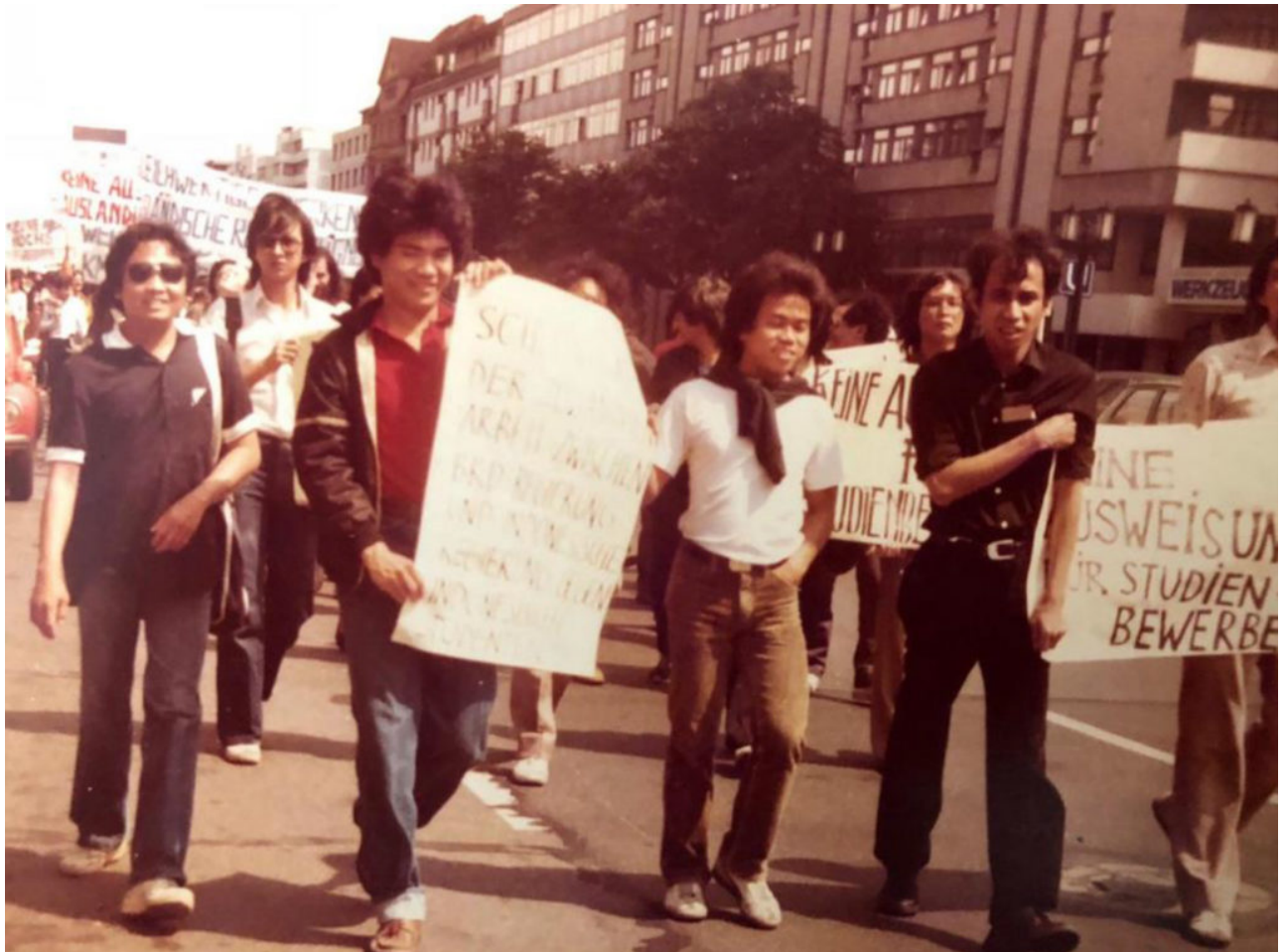
Suhartos langer Arm in der BRD

Indonesien - Indonesische Studierende wurden in Deutschland von der eigenen Regierung überwacht und bedroht. Handelte es sich um Einzelfälle oder systematisches Vorgehen? Wie reagierte die Bundesregierung? Fragen wie diesen geht das lesenswerte Buch "Zwischen Repression und Opposition" nach.