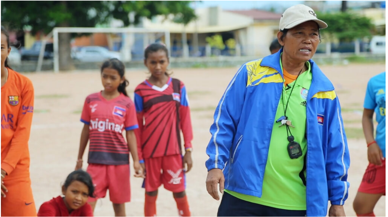
Fußball als Wegweiser

Kambodscha - Der Dokumentarfilm „Lotus Sports Club“ erzählt von einer Fußballmannschaft, die offen für LGBTI- Spieler*innen ist. Teenager finden so im Sport eine stärkende Gemeinschaft und Selbstvertrauen.