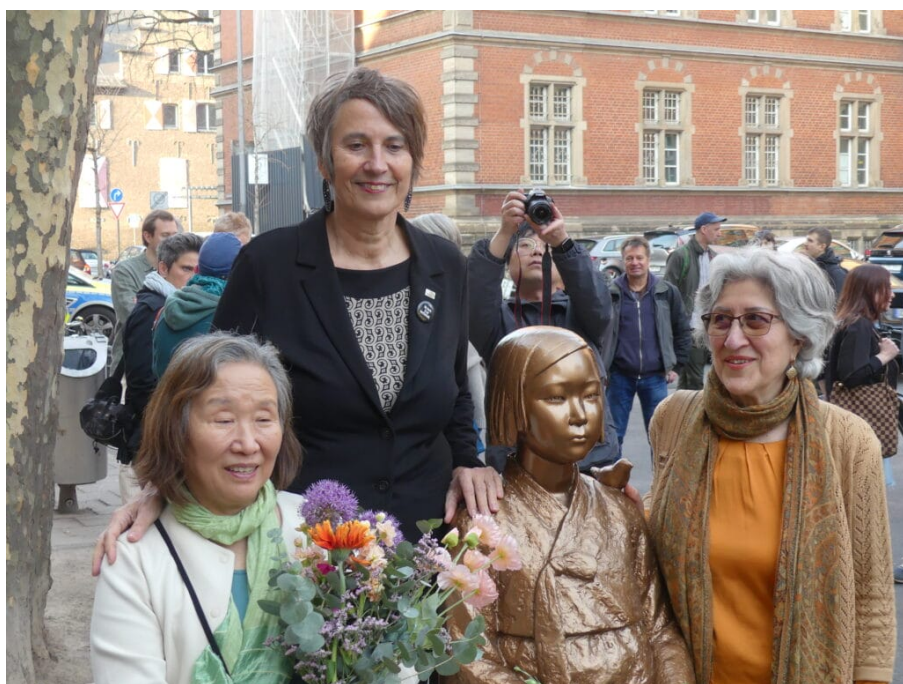
Enthüllung der Friedensstatue „Dông Mai“ im März 2025 vor dem NS-Dokumentationszentrum in Köln.

Die 1927 geborene Iteng* berichtete im Gespräch mit Janssen, wie Sie im Alter von 15 Jahren von Soldaten verschleppt und in ein Bordell nach Sukabumi verschleppt wurde. Selbst nach schwerer Krankheit musste Sie einem Offizier, der sie „zur Heilung“ mit zu sich nach Hause genommen hatte, bis zum Kriegsende „dienen“. Danach kehrte sie nicht mehr in Ihr Dorf zurück. Denn es waren nicht etwa die Täter, die sich schämten, sondern die Opfer.